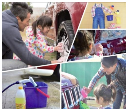
親子洗車のイメージ