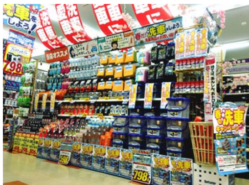
『洗車の日』特設売場