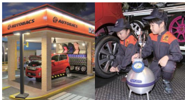
キッズニア イメージ

今後も、『クルマのことならオートバックス』とお客様から支持・信頼される活動の実践」というグループの方針に基づき、クルマのことなら何でもご相談いただける店舗を目指します。