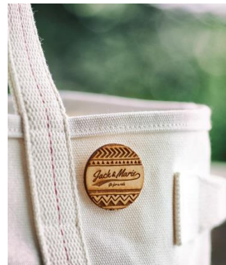
ウッドバッジ 500 円