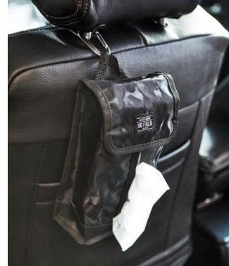
ティッシュケース 1,400 円