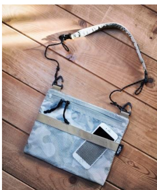
タクティカルサコッシュ 2,800 円