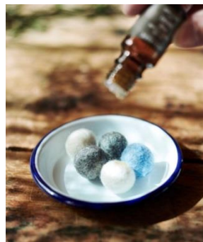
アロマボール 600 円