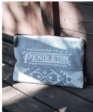
PENDLETON コラボレーション メルトクラッチ 5,500 円