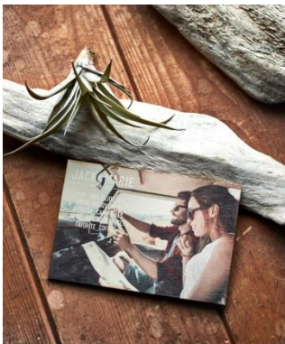
ウッドポストカード 900 円