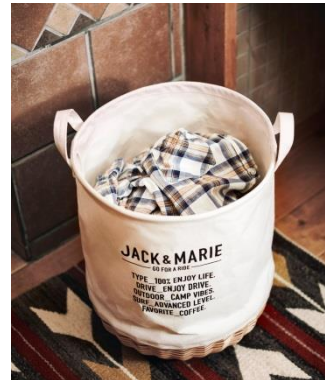
ウィローバスケット アイボリー 2,500 円