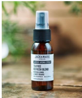
アロマスプレー リフレッシュアブレンド / AUSSIE アブレンド / リラックスアブレンド 各 1,000 円