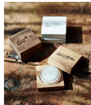
ソリッドパフュームスクエア リフレッシュ/AUSSIE/リラックス 各 2,300 円