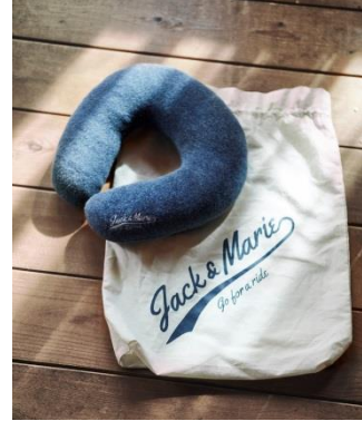
ネックピロー ネイビー (収納ケース付) 2,100 円