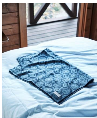
ブランケット ネイティブ 3,200 円