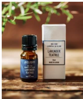
アロマオイル 1-カリラベンダー-ラベンダーティーツリー / ヒナ 各 1,500 円