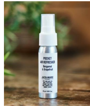
ポケットエアリフレッシュャー ベルガモット&グレープフルーツ/レモン&ラベンダー / シタールウッド&ホワイトムスク / ヒヤシンス&タンジエリン/パンプキン&ジャスミン 各 450 円