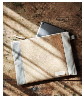
コルククラッチバッグ 5,900 円