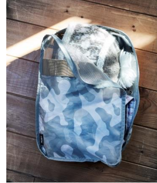
ラゲジオーガナイザー S 2,100 円