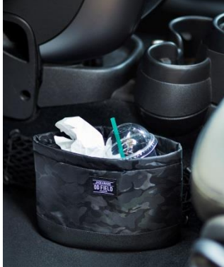
ダストボックス 1,600 円