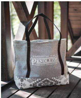
PENDLETON コラボレーション メルトトートバッグ 10,000 円