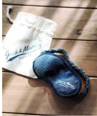
アイマスク ネイビー (収納ケース付) 1,200 円