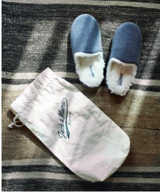
ルームシューズ ポア ネイビー (収納ケース付) 2,400 円