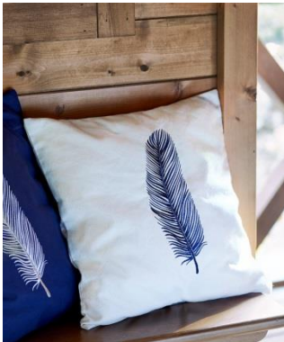
クッションカバー フェザー アイボリー/ネイビー/グレー 各 2,400 円