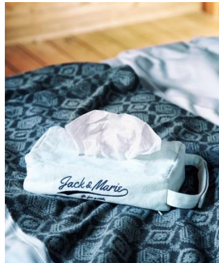
ティッシュケース フェザー アイボリー/ネイビー/グレー 各 1,800 円