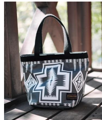
PENDLETON コラボレーション ミニトートバッグ 5,500 円