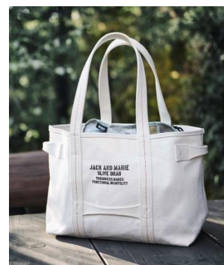
タクティカルキャンバストート M 9,000 円