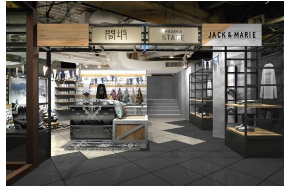
渋谷ロフト間坂ステージ 設営イメージ

店舗名 : JACK&MARIE 渋谷ロフト間坂ステージ店 出店場所 : 渋谷ロフト1階 間坂ステージ (東京都渋谷区宇田川町 21-1) 出店期間 : 2017年12月16日(土)～12月28日(木) 営業時間 : 10:00～21:00 定休日 : なし