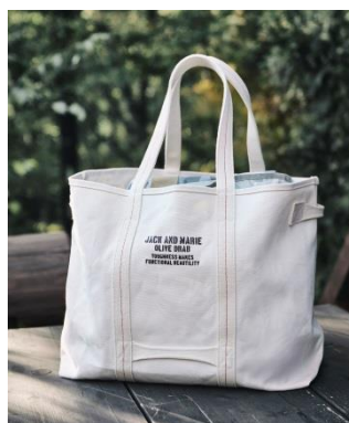
タクティカルキャンバストート L 10,000 円