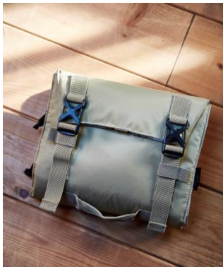
フォールディングポーチ 3,500 円