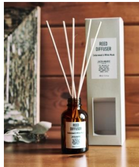
リードディフューザー ベルガモット&グレープフルーツ/レモン&ラベンダー / シタールウッド&ホワイトムスク / ヒヤシンス&タンジエリン/パンプキン&ジャスミン 各 2,000 円