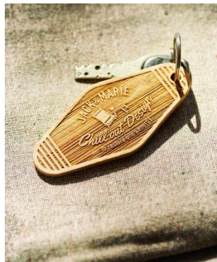
バンブーキータグ 1,750 円