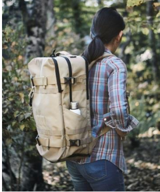
ユーティリティバッグパック 18,000 円