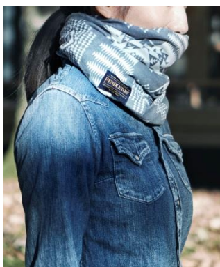
PENDLETON コラボレーション ネックウォーマー 6,000 円