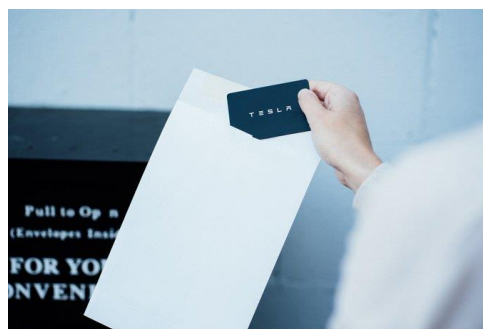
タッチレス試乗（イメージ）