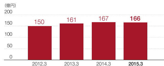
車検・整備 売上高*の推移

*チェーン全体の自動車関連国家資格(自動車整備士1級・2級・3級)の延べ保有者数を表示しています。