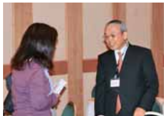
株主さまと湧田社長の懇談