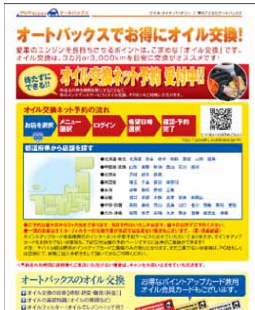
ウェブサイト(デザインは一部異なる可能性があります)

※1 オートバックス、スーパーオートバックス等。一部の新規店舗は準備が整い次第サービスを開始