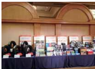
株主さま向け休憩室の商品展示