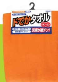
AUTOBACS PRO ドでかタオル DT-01

「AUTOBACS PRO ドでかタオル」は大判サイズで吸水性に優れ、拭き取り用に最適です。「ソフト99 ヌリヌリガラコ デカ丸」は、フロントガラスなどに塗ると約45km/hで雨が弾き飛び、爽快な視界が得られます。