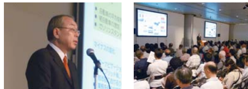
個人投資家説明会の様子

個人の株主・投資家の皆様に、当社グループの事業や取り組みへの理解を深めていただくために、2014年3月期は、東京(2回)、大阪、名古屋で個人投資家向け説明会を合計4回開催しました。開催の告知は、ホームページに掲載しています。また、IRメール配信サービスでもご案内していますので、お気軽にご登録ください。