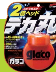
ソフト99 ヌリヌリガラコ デカ丸