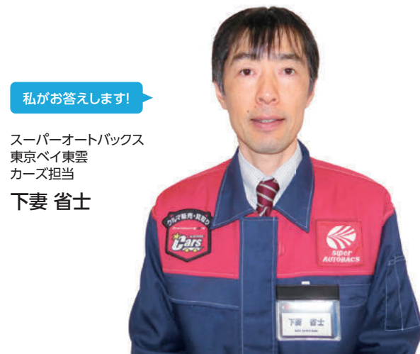
私がお答えします!

愛車を手放す際、なるべく高く買い取ってほしいというのは皆さん共通の願いだと思います。売却には、次のクルマの購入店(ディーラーなど)での「下取り」と、中古車の買取専門店での「査定・買取」の2つの方法がありますが、最近では「査定・買取」が一般的になってきています。というのも、買取の流通経路のコスト削減やその他の理由により、下取りよりも高い査定額が提示されることがあるためです。また、査定では外装・内装の美観も評価項目となっており、愛車をきれいにしておくなど、ひと手間かけるだけでも査定金額は変わってきます。ほかにもいくつかのポイントをご紹介しますので、ご参考にしてください。