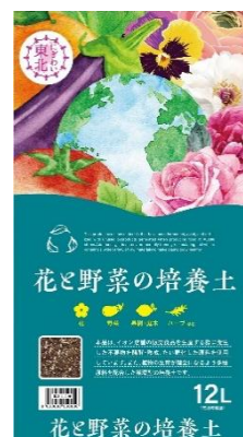
「花と野菜の培養土」

宮城県産パプリカを製造している株式会社ベジ・ドリーム栗原からパプリカの生産過程で出た葉や茎などの食品残渣を活用した「花と野菜の培養土」を販売します。