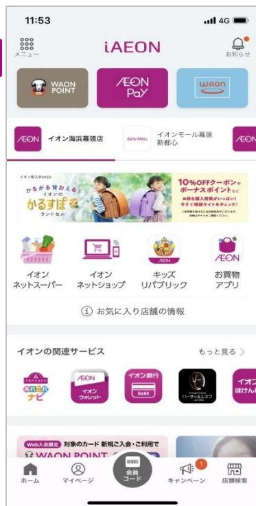
イオンのトータルアプリ「iAEON」