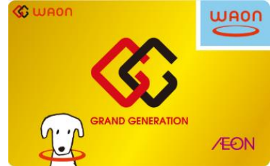
G. G WAON