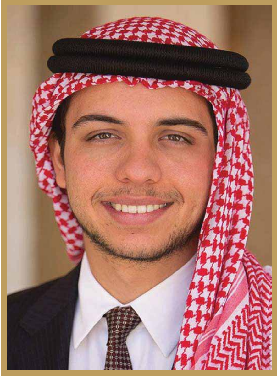
صاحب السمو الملكي الأمير الحسين بن عبد الله الثاني المعظم ولي العهد