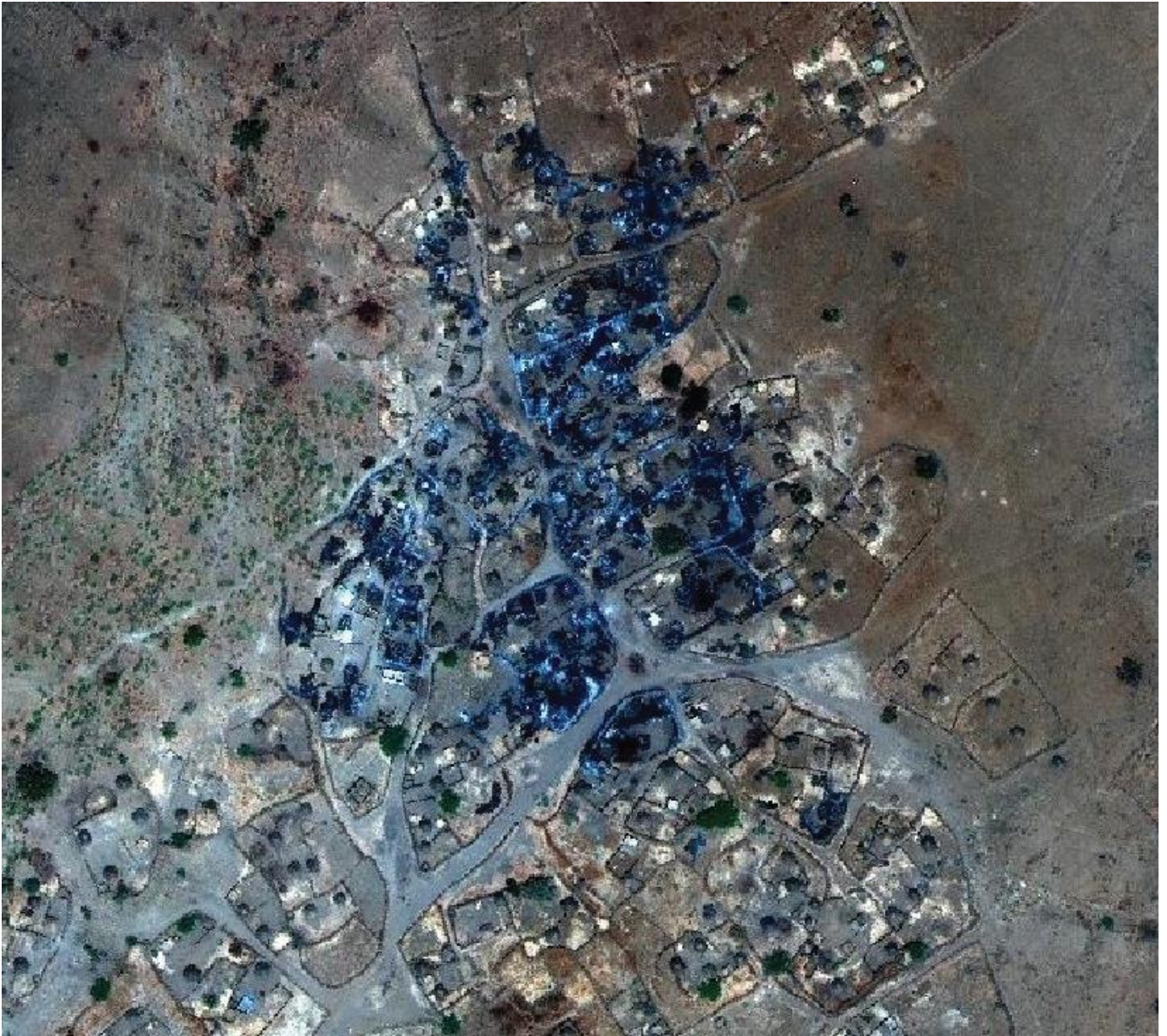
Villaggio dell'area dei monti Jebel Marra dopo un bombardamento con armi chimiche (Aprile 2016)