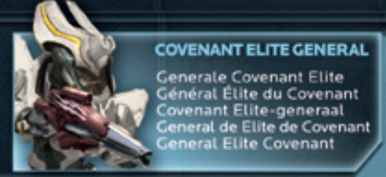
COVENANT ELITE GENERAL Generale Covenant Elite Général Elite du Covenant Covenant Elite-generaal General de Elite de Covenant General Elite Covenant