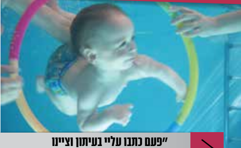
"פעם כתבו עליי בעיתון וציינו בכותרת שזה טיפול (ש)מיימי"

האם את ממליצה לעסקים אחרים להתמקם ביש"ע? "אם זה קרוב אליהם ולא יהווה טרחה, אז בוודאי."