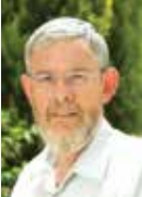
הרב ד"ר יהודה בנדס ראש המכללה האקדמית הרצוג