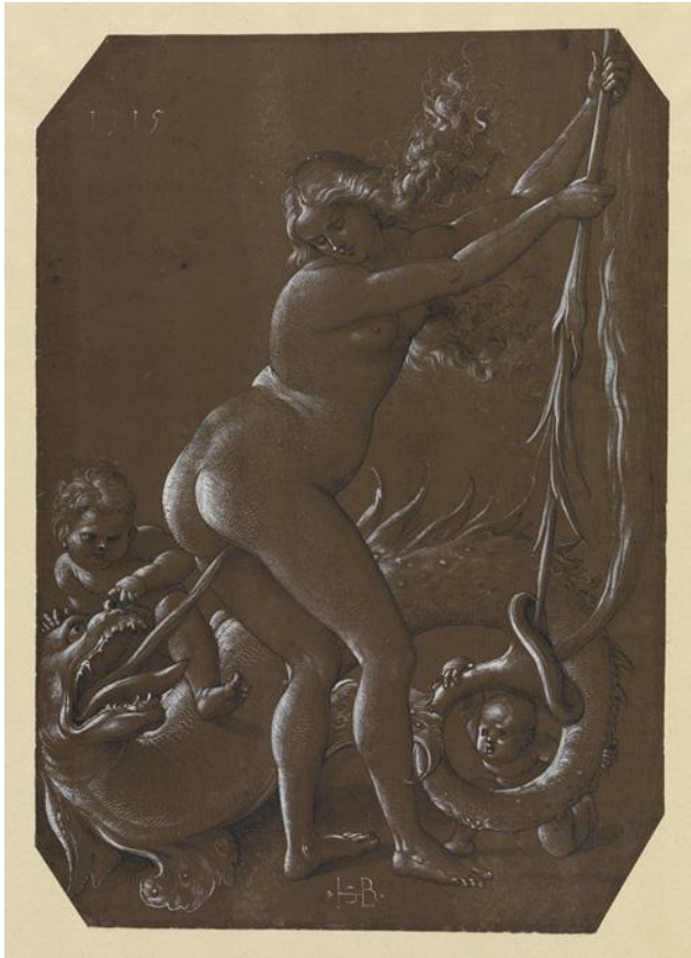
Hans Baldung Grien, Witch and Dragon , 1515, pen and ink with white highlights on brown, prepared paper, 29.5 x 20.7 cm. Karlsruhe, Staatliche Kunsthalle, Kupferstichkabinett. Inv. Nr.VIII.1061-1

Εξετάζοντας προσεκτικά τα φυλλάδια περί δαιμονικής μαγείας και τα πρακτικά των δικών της εποχής, διαπιστώνουμε τη συνάντηση των αντιλήψεων των λογίων (ενίοτε διατυπώνονταν με εκλαϊκευτικό τρόπο και διαχέονταν προς τις μάζες) με τις λαϊκές δοξασίες, προλήψεις και προκαταλήψεις. Υπενθυμίζουμε ότι οι τελευταίες ήταν διανθισμένες από διάφορες παραδόσεις, συνεπώς, δεν συγκροτούσαν ποτέ ένα συνεκτικό και οργανωμένο σώμα πεποιθήσεων, με αποτέλεσμα να υποστούν λόγιες οργανωτικές και κατευθυντήριες υποδείξεις. Τα φυλλάδια που αναφέρονταν σε υποθέσεις δαιμονικής μαγείας και εκδίδονταν στην πρώιμη νεωτερική Αγγλία αποτελούσαν μέρος της προσπάθειας για την επαναφορά ενός «ορθού» προτεσταντικού δόγματος. Η διάδοση τέτοιων φυλλαδίων –με τη συμβολή της διαρκώς αναπτυσσόμενης τυπογραφίας– προς τους λόγιους ή ημιαναλφάβητους αναγνώστες, όπου και αν βρίσκονταν στην επικράτεια (οι οποίοι υποθέτουμε ότι μετέδιδαν αφηγηματικά τα γραφόμενα στους αναλφάβητους συγκατοίκους και συγχωριανούς) υπήρξε εκτεταμένη. Το πρώτο αγγλικό φυλλάδιο δαιμονικής μαγείας,