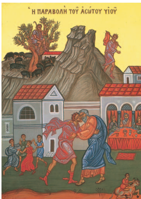
Εικ. 39 η : Η παραβολή του άσωτου υιού. Σχέδιο Γ. Νικοηακόπουλου, από την τοιχογραφία της Μονής της Μεγίστης Λαύρας, Άγιον Όρος.