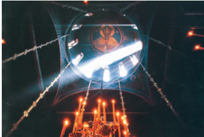
Εικ. 37 η : Ο Παντοκράτορας στην κορυφή του τρούθλου, ως το πρώτο φως, συνέχει και ενοποιεί τα πάντα.