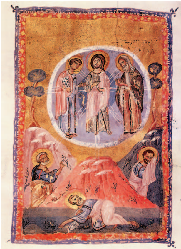
Εικ. 35 η : Η Μεταμόρφωση, 12ος αι. μ.Χ., Μονή Παντελεήμονος, Άγιον Όρος.

Ο Χριστός είχε προτρέψει τους μαθητές του να μεταφέρουν σε όλους τους ανθρώπους το φωτεινό μήνυμα του Ευαγγελίου. Τους είπε: «Εσείς είστε το φως του κόσμου» (Μαθ. 5,14). Στους αιώνες που ακολούθησαν οι Πατέρες και οι Άγιοι της Εκκλησίας μας φωτίστηκαν και φώτισαν με το αληθινό φως του Χριστού και το μετέδωσαν σε όλη την οικουμένη, δείχνοντας σε όλους μας το δρόμο για τη σωτηρία.