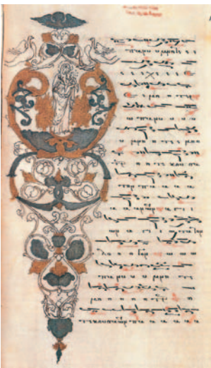
Εικ. 36 η : Μουσικό χειρόγραφο με «Οίκους της Θεοτόκου» από τη Μονή Βατοπαιδίου, Άγιον Όρος.

Εσπερινός: ακολουθία αγάπης και ευχαριστίας