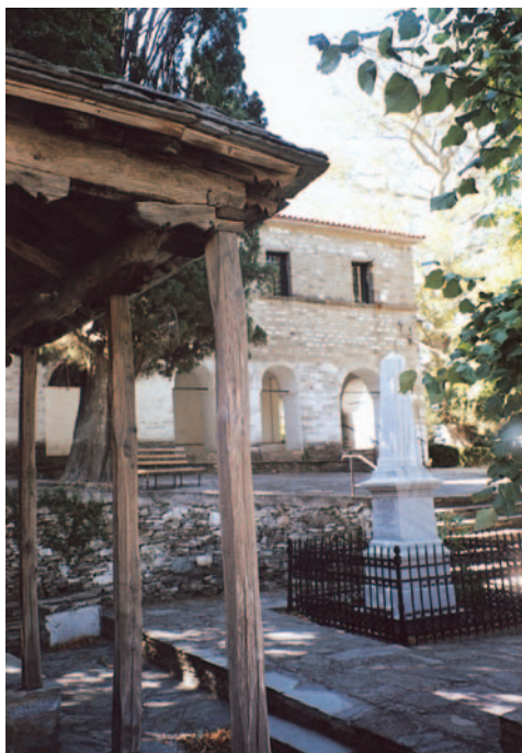
Εικ. 38 η : Ο Άγιος Νικόλαος Πορταριάς, Πήλιο.