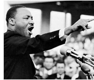
Μάρτιν Λούθερ Κινγκ: Ένας αγωνιστής για τα δικαιώματα όλων των ανθρώπων.

«Οι άνθρωποι», συνέχισε ο δάσκαλος, «πολλές φορές στην ιστορία πήραν μέρος σε αγώνες για τη δικαιοσύνη. Ένας από αυτούς, ο Μάρτιν Λούθερ Κινγκ, σπουδαίος άνθρωπος και γενναίος αγωνιστής, πρόσφερε τον εαυτό του πριν από πολλά χρόνια στον αγώνα για την ισότητα και τη δικαιοσύνη ανάμεσα στους ανθρώπους. Ο ίδιος ήταν μαύρος κι ένιωθε βαθιά μέσα του την αδικία και τις διακρίσεις εναντίον όσων είχαν άλλο χρώμα, όπως αυτός. Ο αγώνας του ήταν τόσο σκληρός, ώστε τελικά θυσιάστηκε για τις ιδέες του. Ωστόσο, το κήρυγμά του έμεινε ζωντανό, και τελικά έγινε πραγματικότητα! Αυτό που κράτησε το κήρυγμά του ζωντανό ήταν η φλόγα της αγάπης για τον συνάνθρωπο, όσο διαφορετικός και αν είναι. Έλεγε ότι ο άνθρωπος δεν πρέπει να κρίνεται από το χρώμα του αλλά από τον χαρακτήρα του και ονειρευόταν τη μέρα που μικρά μαύρα αγόρια και κορίτσια θα κρατούσαν από το χέρι μικρά λευκά αγόρια και κορίτσια σαν αδέρφια τους».