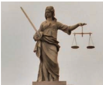
Σπαθί και ζυγαριά: Η Δικαιοσύνη ζυγίζει την αλήθεια και αγωνίζεται για να λάμψει.

Σήμερα η Ζωή είναι πολύ λυπημένη. Αυτή που ξεσήκωνε με τα γέλια και τις φωνές της την τάξη, τώρα είναι σοβαρή και αμίλητη. Κάθεται στο θρανίο της, αλλά το βλέμμα της ταξιδεύει αλλού. Ο δάσκαλος την κοιτάζει κι αυτός λυπημένος. Πώς να εξηγήσει, όμως, στα παιδιά ότι η αγαπημένη τους συμμαθήτρια είναι στεναχωρημένη, διότι χθες ο πατέρας της, μετά από τόσα χρόνια εργασίας, απολύθηκε ξαφνικά από τη δουλειά του και πλέον είναι άνεργος; Πώς να τους δώσει να καταλάβουν ότι η αδικία υπάρχει, όπως υπήρχε πάντοτε στον κόσμο, αλλά δεν είναι παντοδύναμη;