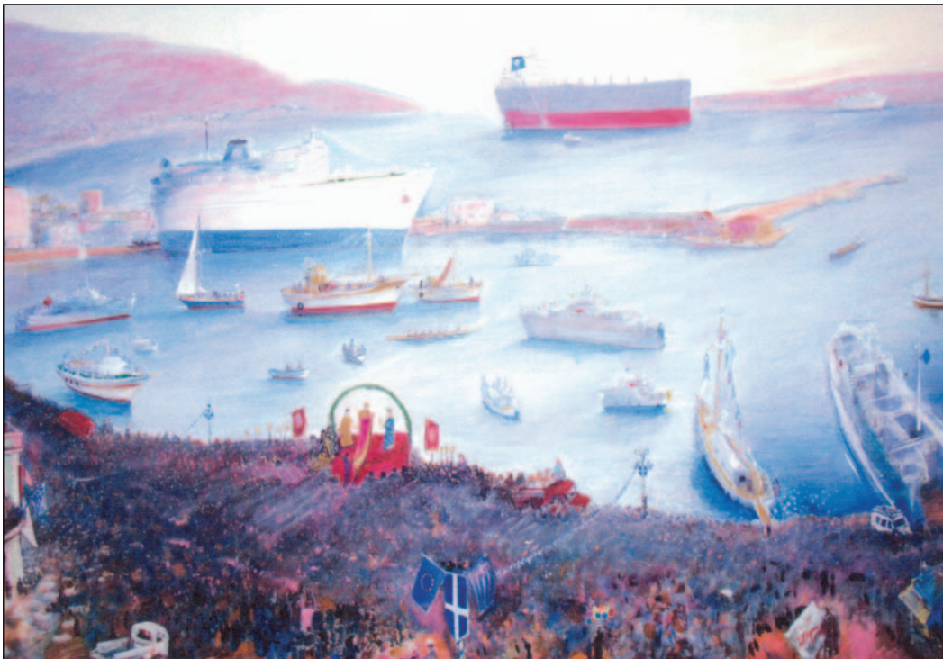
Γιώργος Ζυμαράκης, Θεοφάνια στη Χίο (1996).

Επίσης τα παλιά χρόνια πίστευαν ότι με τον αγιασμό των νερών χάνονται οι καλικάντζαροι* και σκορπίζεται κάθε κακό. Ακόμη ότι το βράδυ της παραμονής των Φώτων ανοίγουν οι ουρανοί και ότι το νερό της θάλασσας από αλμυρό γίνεται γλυκό!