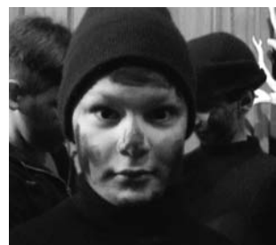
«Ο Ανάποδος Καλικάντζαρος», θεατρική παράσταση των 20ού και 7ου Δημοτικών σχολείων Ν. Ιωνίας (2004)