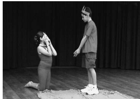
Αυτοσχεδιασμός στο «Μικρό Πρίγκιπα» (Θεατρ. Εργαστήρι των συγγραφέων)

Η Αλεπού πάλι που έχει χαρακτηριστικά ζώου, αλλά έχει ανθρώπινη συμπεριφορά, φορά μόνο μια μάσκα δηλωτική της ζωομορφίας της. Καλό είναι να παιχθεί από ένα κορίτσι, που θα ντυθεί με ένα απλό κι ωραίο φουστάνι σε γήινο χρώμα. Η ιδέα είναι να μοιάζει με ένα αθώο κορίτσι γεννημένο στη φύση.