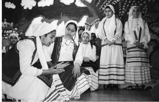
74ο Δημοτικό Σχολείο Αθηνών

Γιώργαινα: Μα δε φυτρώνει ούτε χορτάρι. (Κουνά τα χέρια της με απελπισία) Τα τσαρούχια μας τα φάγαμε, τα φύκια και τα σκουλήκια και τα ποντίκια τα φά-