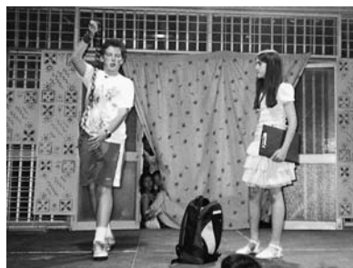
92ο Δημοτικό Σχολείο Αθηνών

ΔΗΜΑΡΧΟΣ: Η δασκάλα! Πάρτε τα γρήγορα! Πάρτε τα και τα δύο! Κλείστε τα στο σχολείο και βάλτε τα τιμωρία!