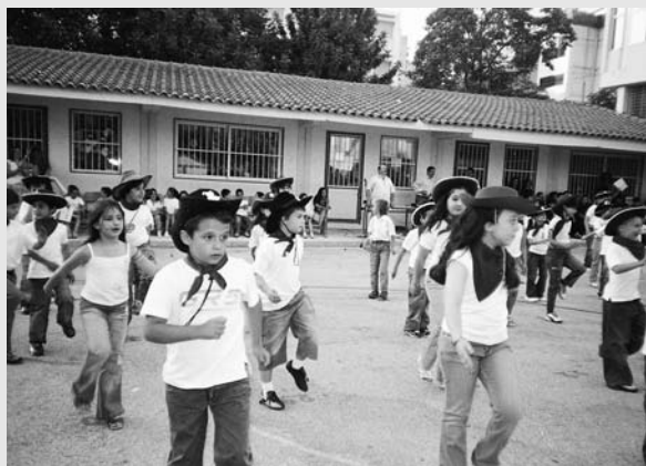
92ο και 97ο Δημοτικό Σχολείο Αθηνών