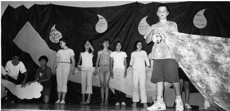
1ο Δημοτικό Σχολείο Βριλησίων

Αξιοποιούμε όλες τις φωνητικές δυνατότητες των παιδιών. Όταν τα παιδιά μπαίνουν στο ποτάμι και κολυμπούν, τα υπόλοιπα παιδιά με τη φωνή τους κάνουν τους ήχους του νερού αυξομειώνοντας την ένταση ανάλογα με τα σαλαβουτήγματα. Η σκηνή μπορεί να υποστηριχτεί με μουσικά όργανα ή αντικείμενα που να παράγουν ήχους αναμονής (νιώθουν άρρωστα, περιμένουν το γιατρό) ή έντασης (πέφτουν στο ποτάμι, παίζουν τους Ινδιάνους). Γενικά, το καλύτερο είναι τα παιδιά με τη φωνή τους (και κάποτε με τη βοήθεια ηχογραφημένων θορύβων) να δίνουν ηχητικά - φωνητικά την αντίστοιχη ατμόσφαιρα της σκηνής.