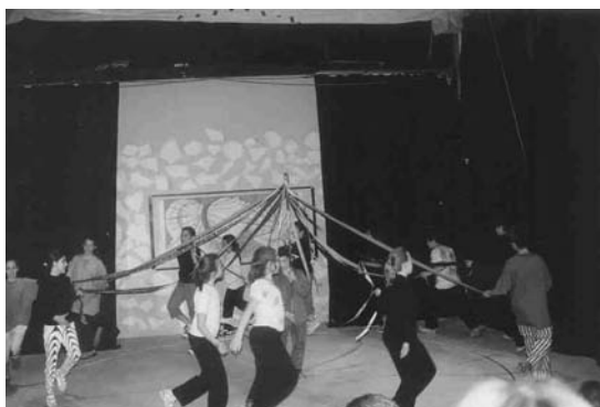
Θεατρική παράσταση «Το Γαϊτανάκι» Σαρρή, Υπαίθριο Θέατρο Δημοτικού σχολείου Κολλεγίου Αθηνών (Δ' Τάξη, 2000)

Στη σκηνή της μεταμόρφωσης του Νικόλα, ο γερο - Νικόλας μπορεί να φορά περούκα με άσπρα μαλλιά που στη συνέχεια θα βγάλει. Αν όμως φορέσει μια περούκα σε πρασινωπή απόχρωση και πέσει πάνω του μπλε φωτισμός προβολέα, τότε τα μαλλιά της περούκας θα μαυρίσουν και μπροστά στα μάτια των θεατών ο γερο -Νικόλας θα γίνει νέος. Στο τέλος ένας φωτεινός κύκλος στο πάτωμα θα γίνει το Γαϊτανάκι και μέσα σ' αυτόν τα παιδιά θα τραγουδήσουν και θα χορέψουν.