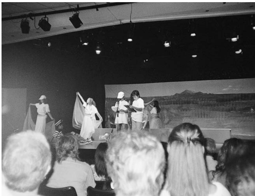
11ο Δημοτικό Σχολείο Αργυρούπολης