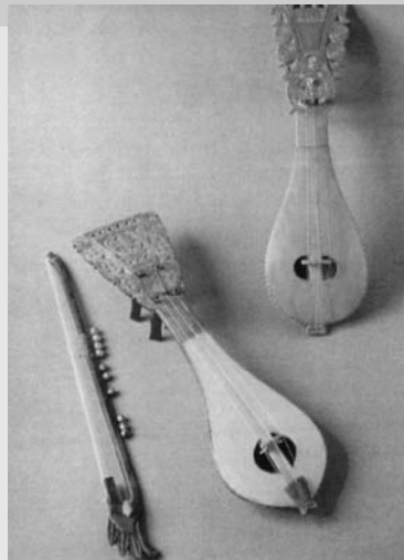
Αχλαδόμψες Λύρες Κρήτης 18ου αιώνα. Δοξάρι με γερακοκούδουνα. Μουσείο Ελληνικών Λαϊκών Μουσικών Οργάνων