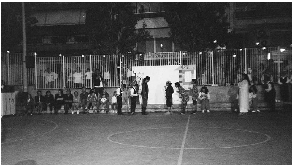
123ο Δημοτικό Σχολείο Αθηνών