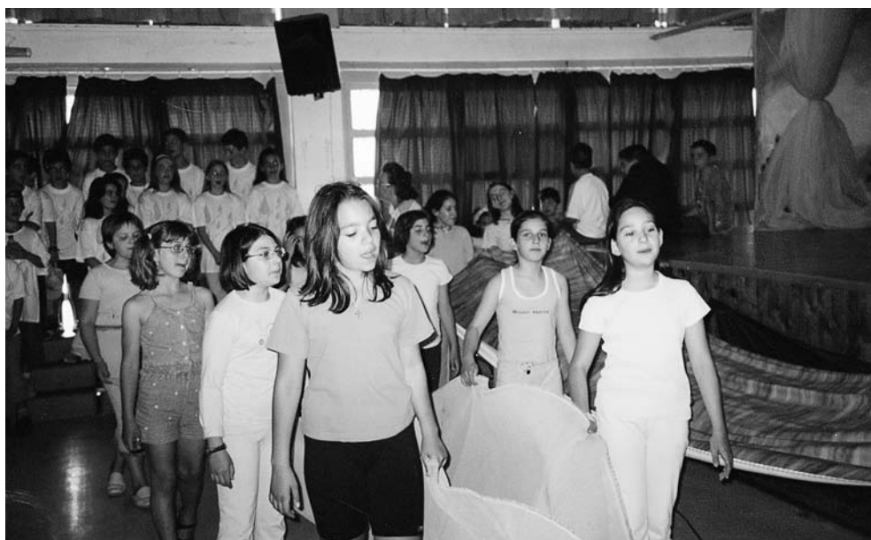
1ο Δημοτικό Σχολείο Βριλησίων

Και ο Καραγκιόζης μπορεί να βρει πολλές ευκαιρίες για παράσταση, ακόμη και στο πλαίσιο ενός ανάλογου πολιτιστικού προγράμματος.