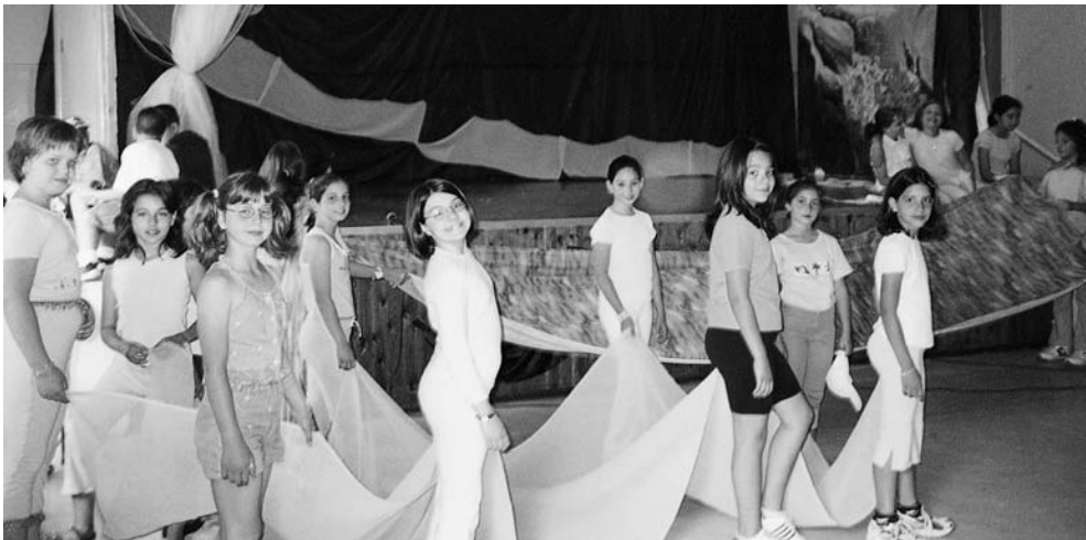
Το Δημοτικό Σχολείο Βριλησίων