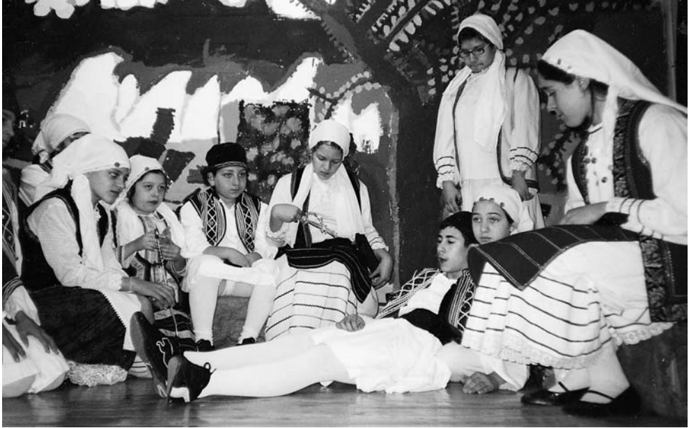
74ο Δημοτικό Σχολείο Αθηνών