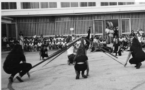
92ο και 97ο Δημοτικό Σχολείο Αθηνών

Έτσι, την πρώτη μέρα της άνοιξης όλοι οι νέοι του κόσμου δίνουν τα χέρια, τραγουδούν και χορεύουν ΤΟ ΓΑΪΤΑΝΑΚΙ ΤΗΣ ΕΙΡΗΝΗΣ.