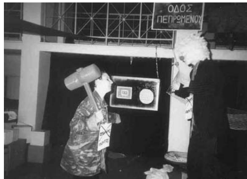
Θεατρική παράσταση «Τα γουρουνάκια κουμπαράδες» του τμήματος Νηπιαγωγών Πανεπιστημίου Αθηνών

Ο Όσκαρ (υπηρέτης) φορά εκτός από τα ρούχα γουρουνιού ένα γιλέκο χρωματιστό.