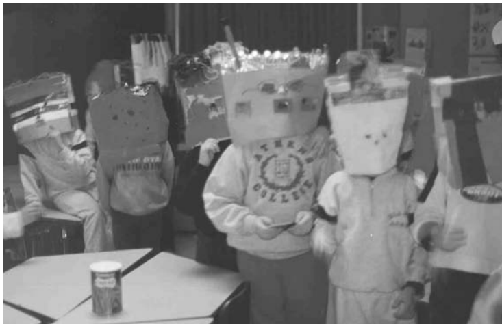
Δημ. Σχολείο Κολλεγίου Αθηνών

Στο τέλος, μπορεί να γίνει ένα μεγάλο φαγοπότι, με εδέσματα από διαφορετικά μέρη του κόσμου, όπου όλοι τρώνε μαζί.