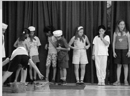
Αυτοσχέδια όργανα (Θεατρ. Εργαστήρι των συγγραφέων)