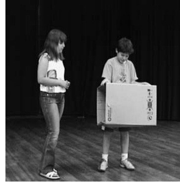
Αυτοσχεδιασμός στο «Μορμόλη» (Θεατρικό Εργαστήρι των συγγραφέων)