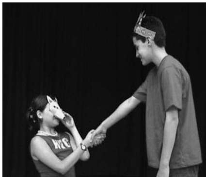
Αυτοσχεδιασμός στο «Μικρό Πρίγκιπα» (Θεατρικό Εργαστήριο των συγγραφέων)

Η Αλεπού εκφράζει τον κόσμο της Ψυχής, τον Άνθρωπο που γνωρίζει τον εαυτό του αλλά και τη σημασία της αληθινής επικοινωνίας. Αυτή μαθαίνει στο Μικρό Πρίγκιπα τις αξίες της ζωής.