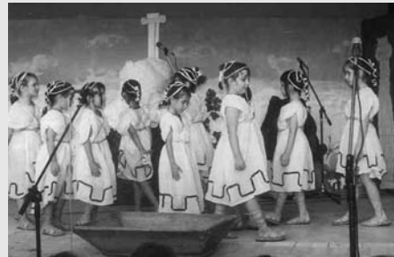
Θεατρική παράσταση «Ειρήνη» Παιδικού Τμήματος Δήμου Μαρκόπουλου

Τσουβάλι, μεγάλο γουδί, γουδοχέρι, σχοινί, κύπελλα, κανάτες, μουσικά όργανα