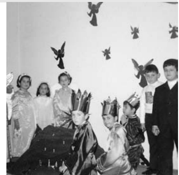
45ο Δημοτικό Σχολείο Πειραιά