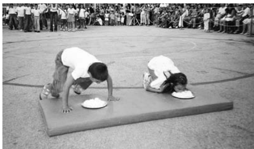
92ο και 97ο Δημοτικό Σχολείο Αθηνών

Σημείωση: Το παιχνίδι μπορεί να παισιώσει ένα μέρος «Αγώνων» της Γιορτής Λήξης.