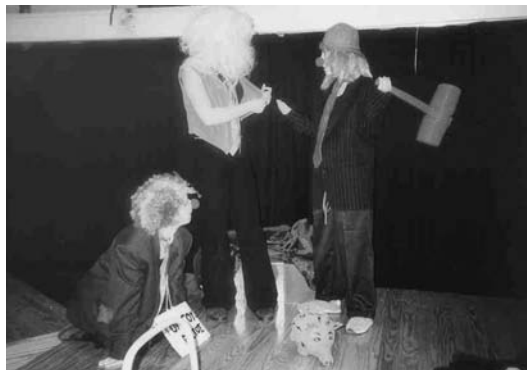
Θεατρική παράσταση «Τα γουρουνάκια κουμπαράδες» του τμήματος Νηπιαγωγών Παν/μίου Αθηνών (αρχ. Μ. Φραγκή)

Ένας μαθητής ρητορεύει και προσπαθεί να δελεάσει το υποψήφιο θύμα του να δοκιμάσει το βοτάνι του δίνοντάς του υποσχέσεις για μια παραδεισένια ζωή.