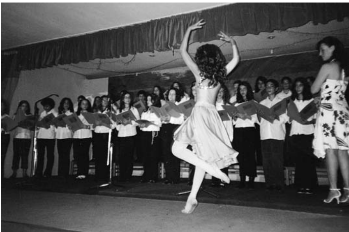
89ο Δημοτικό Σχολείο Αθηνών