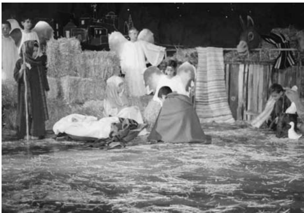
«Γιορτή Χριστουγέννων», Δημοτικό σχολείο Κολλεγίου Αθηνών (Δ΄ Τάξη, 2000)

Η μουσική δυναμώνει, ενώ άπλετος κίτρινος φωτισμός από προβολέα εστιάζεται στη Φάτνη για να αναδείξει τη στιγμή της Γέννησης. Ο Ιωσήφ και η Μαρία σκύβουν πάνω από τη Φάτνη και χαμογελούν στο Βρέφος. Μια κούκλα φασκιωμένη μπορεί να παίζει το ρόλο του «βρέφους». Πάντα η μουσική δυνατά, ενώ μπαίνουν οι άγγελοι, με κοντό άσπρο χιτώνα, φτερά και χρυσό στεφάνι στο κεφάλι. Κινούνται με ελαφρύ βάδισμα, ενώ κουνάνε ανεπαίσθητα τα χέρια μαζί με τα φτερά τους. Στέκονται σε όρθια στάση, με ανοικτά σχεδόν φτερά γύρω από τη φάτνη σαν προστατευτικό τείχος. Ακολουθεί η είσοδος των απλοϊκών βοσκών, με βαρύ βάδισμα: φοράνε προβιές ή δέρματα ανοικτού χρώματος και κρατάνε γκλίτσα στο δεξί χέρι. Σταματάνε στη μια άκρη της φάτνης, σκύβουν ταπεινά προς το βρέφος. Τέλος, ο ένας πίσω από τον άλλο, μπαίνουν οι τρεις Μάγοι, με βήμα μεγαλοπρεπές, ρούχα πολυτελή, διακοσμημένα, μέτωπο στολισμένο με χρυσή ταινία: κρατάνε ακριβά δώρα (κάποια εκκλησιαστικά σκεύη θα ήταν ιδεώδη για την αναπαράστασή μας).