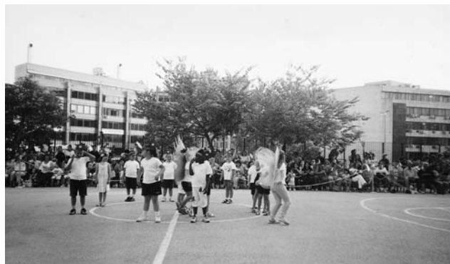
84ο Δημοτικό Σχολείο Αθηνών