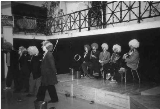
Θεατρική παράσταση «Τα γουρουνάκια κουμπαράδες» του Τ.Ε.Α.Π.Η. Πανεπιστημίου Αθηνών

-κουμπαράδες που χάνονται στην ξενιτιά, γίνονται λύκοι. Ο Ξενοδόχος διευκολύνει αυτή την αλλαγή με ένα μαγικό υγρό και έτσι οι λύκοι που του χρωστάνε τα πάντα δουλεύουν για γι' αυτόν. Ο Φουκαριάρης ακολουθεί τη μοίρα του και μεταμορφώνεται, όμως πάνω σ' αυτή την ώρα εμφανίζεται στο πανδοχείο ο Γουργουριστός ψάχνοντας για το φίλο που τον έσωσε από την επιδρομή των λύκων. Ο Γουργουριστός αναγνωρίζει στο πρόσωπο του λύκου το φίλο του, όμως ο Φουκαριάρης που είναι πια λύκος έχει ξεχάσει. Ο Γουργουριστός τον αγκαλιάζει μετανιωμένος και τότε γίνεται σαν από θαύμα η αναγνώριση. Οι δυο φίλοι καταστρώνουν γρήγορα σχέδιο σωτηρίας και εκδίκησης για το φοβερό Πανδοχέα, που δεν είναι άλλος από τον Ανεμοδούρα τον Συννεφολόγο.