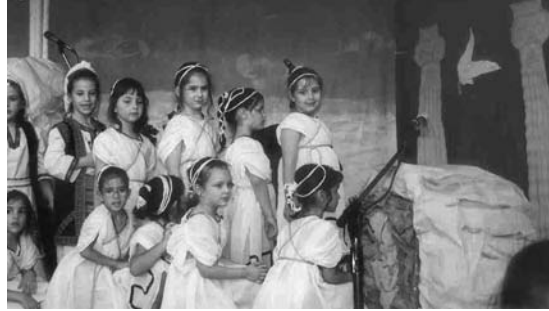
Θεατρική παράσταση «Ειρήνη» Παιδικού Τμήματος Δήμου Μαρκόπουλου

Έι χοπ, έι χοπ! Τραβάτε αργά και κάντε υπομονή. Σιγά σιγά μ' επιμονή η Ρηνιώ στο φως θα βγει. Λεύτεροι τότε θα 'ναι όλοι, θάλασσα, εξοχή και πόλη, ύπνος, ξύπνος και παιχνίδια, καθισό και πανηγύρια.