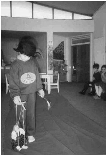
«Κουκλοθέατρο» - Νηπιαγωγείο Αρσακείου

Κατόπιν θα προτείνουν σκηνικές λύσεις για την ατμόσφαιρα του έργου, ιδέες για τα κοστούμια των ηρώων και τα αντικείμενα - σύμβολα που φοράνε ή κρατάνε. Μπορούν να δημιουργήσουν με τη φαντασία μας αντικείμενα από πολύ απλά και φτηνά υλικά. Το θέατρο είναι η τέχνη της μεταμόρφωσης και της μαγείας.