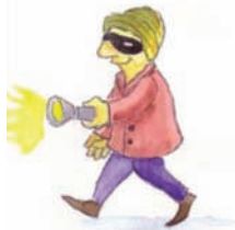
Οι κλέφτες του κυρίου Δημήτρη κρατούσαν φακό για να βλέπουν.

☑ Με το φακό ρίχνουμε φως, όταν είναι σκοτεινά και θέλουμε να δούμε κάτι. ✓ Η θεία Κατερίνα φοράει φακούς επαφής , επειδή τα γυαλιά την κουράζουν. ✓ Με το μεγεθυντικό φακό , μπορείς να δεις έναν κόκκο σκόνης. Τον μεγαλώνεις για να τον δεις καλύτερα. 🎵 φα-κός