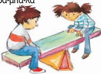
Ο Κώστας και η Αθηνά κάνουν τραμπάλα .