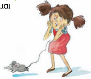
Η Αθηνά φοβήθηκε πολύ μόλις είδε το ποντίκι.