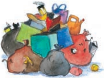
Ένας σωρός από σκουπίδια.