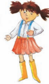
Η Αθηνά φοράει τιράντες στη φούστα της.