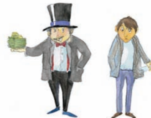
πλούσιος - φτωχός