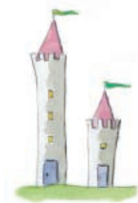
ψηλός - χαμηλός