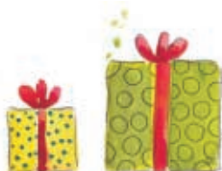
μικρό - μεγάλο