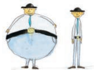
χοντρός - λιγνός