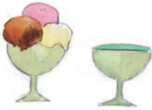
άδειο - γεμάτο