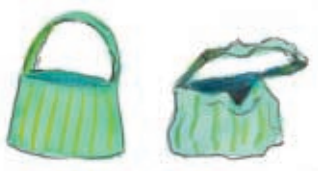
καινούρια - παλιά