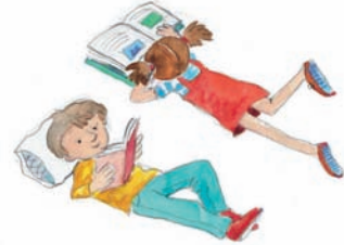
ανάσκελα - μπρούμυτα