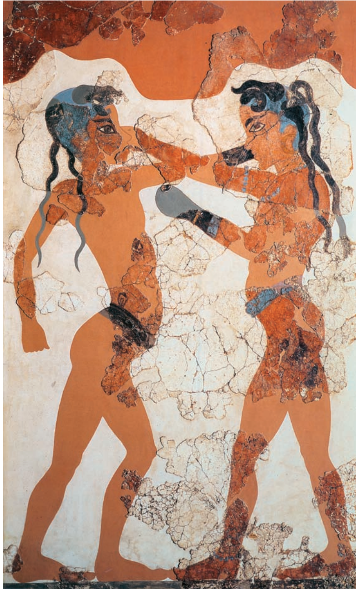
Νεαροί πυγμάχοι. Τοιχογραφία από τη Σαντορίνη. Γύρω στο 1550 π.Χ. Αθήνα: Εθνικό αρχαιολογικό μουσείο.

Η τοιχογραφία αυτή βρέθηκε, όπως είπαμε, στη Θήρα. Επομένως, μπορούμε να πούμε, ότι τα μινωικά αγωνίσματα διαδόθηκαν σε όλο το χώρο του Αιγαίου, ενώ από το 1500 π.Χ. εμφανίζονται και στη Μυκηναϊκή Ελλάδα.