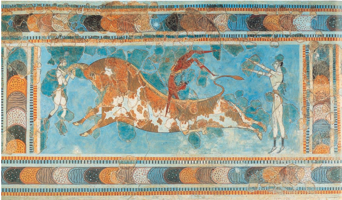
Ταυροκαθάψια: Τοιχογραφία από το ανάκτορο της Κνωσού. Μέσα του 15 ου αιώνα πΧ.

Σχετικά με τους ανθρώπους, τον πολιτισμό τους και τους αγώνες έχουμε συλλέξει πολλά στοιχεία από τοιχογραφίες, που έχουν βρεθεί. Ας παρατηρήσουμε τις δύο αυτές τοιχογραφίες. Τι βλέπουμε;