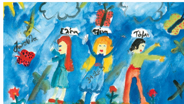
Μηνιάδου Μαρία, Παιδιά στα χίλια χρώματα, εκδ. Ιανός, Θεσσαλονίκη, 2000