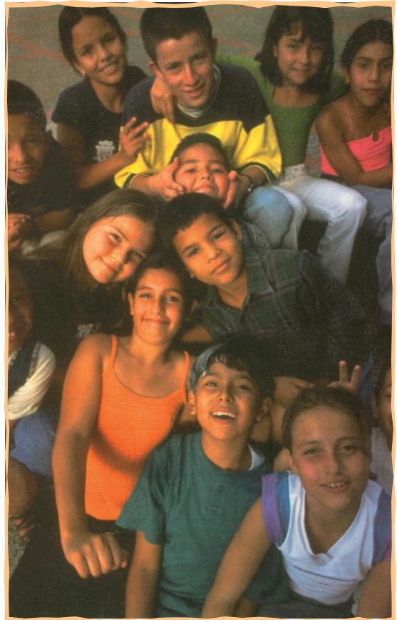
Unicef, Donna De Cesare, περιοδικό Κόσμος, τεύχος 63°, Χειμώνας 2006

Χάρης Σακελλαρίου, Το βιβλίο των τραγουδιών, εκδ. Ελληνικά Γράμματα, Αθήνα, 2002