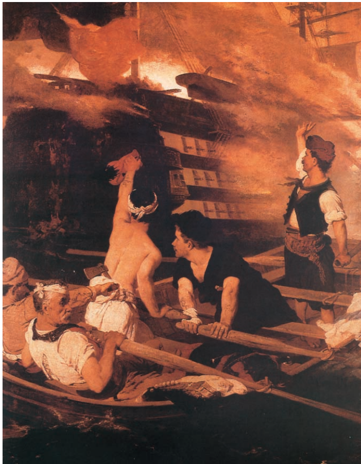
Η πυρπόληση της τουρκικής ναυαρχίδας από τον Κανάρη, Νίκος Λύτρας, Πίνακοθήκη Αβέρωφ. Μίρκα Παλιούρα, Το Λεύκωμα του '21, Διεύθυνση έκδοσης - παραγωγής: ΙΔΡΥΜΑ ΤΥΠΟΥ Α.Ε, 1996

Σπύρος Τρικούπης, Ιστορία της Ελλ. Επανάστασης Αριστοτέλης Χρ. Κωστόπουλος, Βικτωρία Κωτουλοπούλου-Κωστοπούλου, Το θαύμα του 1821 , εκδ. Μαλλιάρης-Παιδεία Α.Ε., Θεσσαλονίκη, 1991