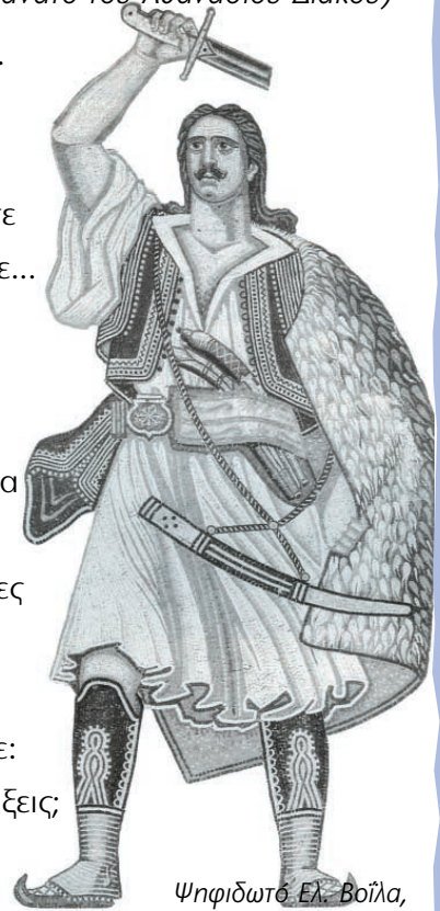
Ψηφιδωτό Ελ. Βοΐλα, Αριστοτέλης Χρ. Κωστόπουλος, Βικτωρία Κωτουλοπούλου- Κωστοπούλου, Το θαύμα του 1821, εκδ. Μαλλιάρης-Παιδεία Α.Ε., Θεσσαλονίκη, 1991

— Εγώ Γραικός γεννήθηκα, Γραικός θε να πεθάνω!