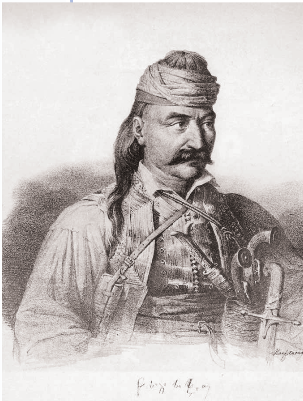
Κολοκοτρώνης, Κ. Krazeisen, 1828 Μίρκα Παλιούρα, Το Λεύκωμα του '21 Διεύθυνση έκδοσης - παραγωγής: ΙΔΡΥΜΑ ΤΥΠΟΥ Α.Ε., 1996

Στον Κεχαγιά έδωσε και μια διαταγή για τους Μεσσήνιους να προσκυνήσουν, ειμή* να αρχίσει το έργο του.