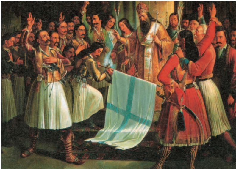
Μίρκα Παλιούρα, Το Λεύκωμα του '21, Διεύθυνση έκδοσης - παραγωγής: ΙΔΡΥΜΑ ΤΥΠΟΥ Α.Ε., 1996

Καζαντζάκης Νίκος, Ο Καπετάν Μιχάλης Αριστοτέλης Χρ. Κωστόπουλος, Βικτωρία Κωτουλοπούλου-Κωστοπούλου, Το θαύμα του 1821, εκδ. Μαλλιάρης-Παιδεία Α.Ε., Θεσσαλονίκη, 1991