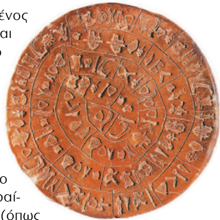
Εγκυκλοπαίδεια Πατάκης-Oxford, Τόμος 15ος, εκδ. Πατάκη, Αθήνα, 2001.

Χρησιμοποιήθηκαν 45 διαφορετικά σύμβολα που χωρίζονται από κάθετες γραμμές. Από το πλήθος των διαφορετικών συμβόλων συμπεραίνουμε ότι είναι πολλά για να είναι γράμματα (όπως αυτά που χρησιμοποιούμε σήμερα), αλλά και λίγα για να είναι ιδεογράμματα, (όπως έχει π.χ. η κινέζικη γραφή), οπότε πρόκειται μάλλον για συλλαβές.