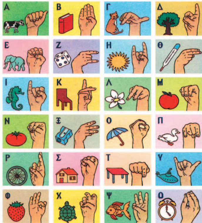
Το αλφάβητο προέρχεται από το έργο ΣΕΠΠΕ του Π.Ι.: «Νόημα στην Εκπαίδευση».