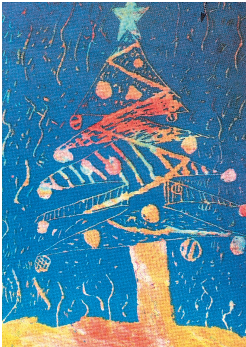
Παιδική εφημερίδα της Καθημερινής. Οι Ερευνητές πλάι παντού, 18/11/2004

Κάλυψε το χαρτί με πολύχρωμα λαδοπαστέλ. Στη συνέχεια το σκέπασε από άκρη σε άκρη με μπλε τέμπερα και όταν αυτή στέγνωσε, χάραξε με μια οδοντογλυφίδα τη χριστουγεννιάτικη εικόνα της κάρτας του.