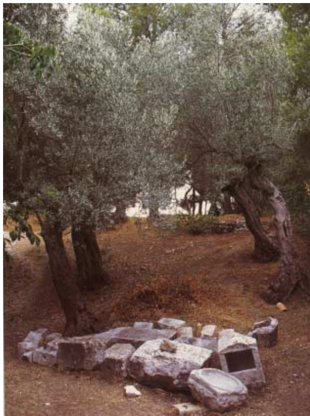
Φωτογραφία από τον αρχαιολογικό χώρο της Επιδαύρου. Νίκος & Μαρία Ψιλάκη-Ηλίας Καστανάς, Ο πολιτισμός της ελιάς, εκδ. Καρμάνωρ, Ηράκλειο, 1999.

Η ρίζα της ελιάς προχωρεί πολύ βαθιά στο χώμα και διακλαδίζεται απλωτά προς όλες τις μεριές, ανάμεσα και από πέτρες ακόμα, ώσπου να συναντήσει υγρασία. Η ελιά, με τις βαθιά απλωμένες ρίζες της, στηρίζεται γερά στο χώμα. Δύσκολα ξεριζώνεται. Ο κορμός της ελιάς γίνεται χοντρός, ψηλός και διακλαδίζεται κι αυτός απλωτά. Μπορεί να φτάσει σε ύψος 25-30 μ. Η εξωτερική φλούδα του κορμού είναι ξερή, γκριζα στα χρώματα και έχει εξογκώματα. Όταν το δέντρο γερνά, ο κορμός σχηματίζει κουφάλες. Τα φύλλα της ελιάς είναι μικρά κι έχουν μικρό μίσχο. Η πάνω επιφάνεια του φύλλου έχει χρώμα ανοιχτό πράσινο και η κάτω ασημένιο. Τα φύλλα βγαίνουν από τα κλαδιά αντίθετα κι έτσι δε σκιάζει το ένα το άλλο. Τα άνθη της ελιάς φυτρώνουν πολλά μαζί (15-25) αλλά δε μυρίζουν. Βγαίνουν από τους βλαστούς της περασμένης χρονιάς. Η ελιά ανθίζει τον Απρίλιο -Μάιο. Ο καρπός, πριν ωριμάσει, έχει χρώμα πράσινο. Ωριμάζοντας παίρνει χρώμα μολυβί ή μαύρο. Οι καρποί της ελιάς αρχίζουν να ωριμάζουν τον Οκτώβριο. Το μάζεμα του καρπού αρχίζει το Νοέμβριο και σε πολλά μέρη διαρκεί ως το Μάρτιο.