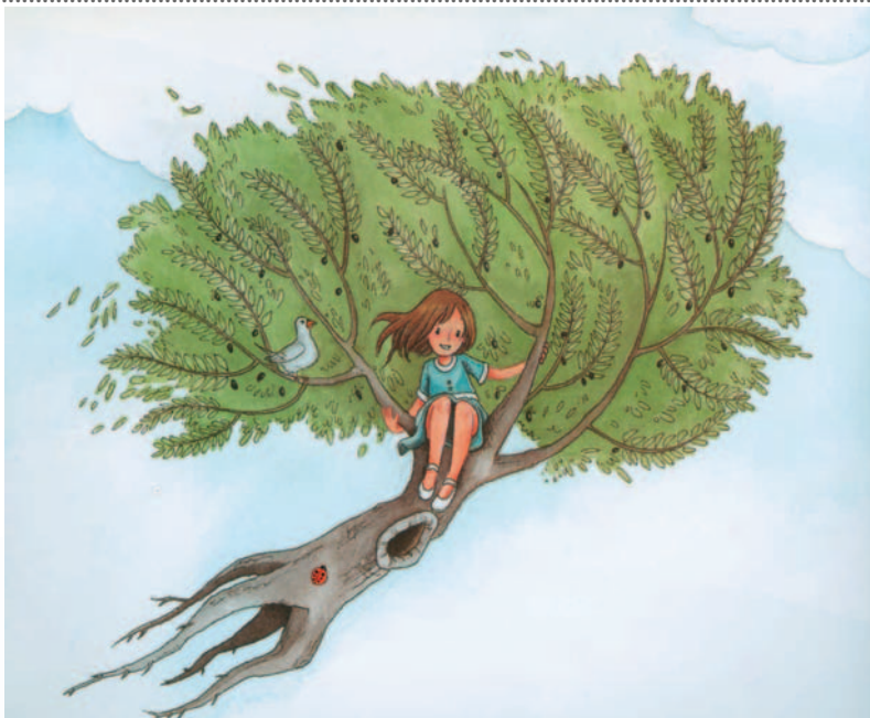
Ευγένιος Τριβιζάς, Η Λέσποινα και το περιστέρι, εκδ. Ελληνικά Γράμματα, Αθήνα, 2003