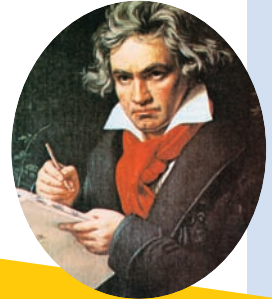
Λούντβιχ βαν Μπετόβεν