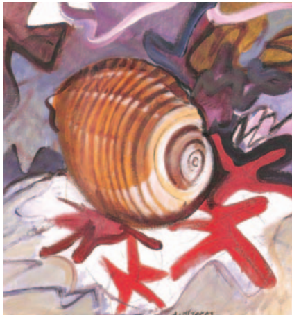
Δημήτρης Μυταράς, Η τόννα

Λόρκα, Φ. Γκ. 1996 4 . Τα ποιήματα . Μετάφραση Δικταίος, Α. Αθήνα: Σ. Ι. Ζαχαρόπουλος