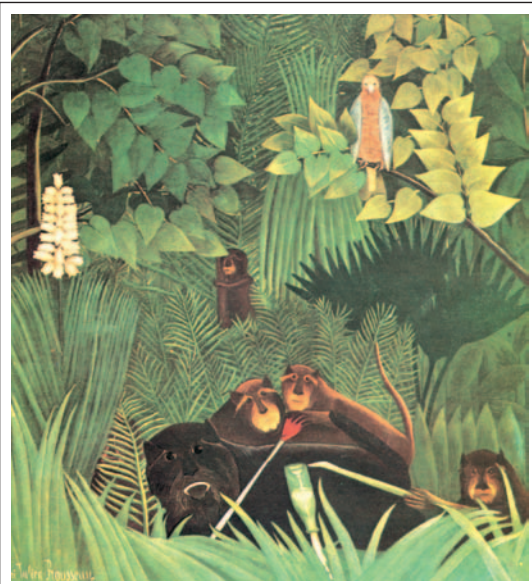
Ανρί Ρουσώ, Μαϊμούδες σε παρθένο δάσος

Παρατηρήστε τους πίνακες. Τι βλέπετε; Συζητήστε στην τάξη.