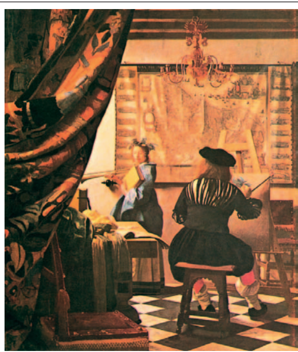
Γιαν Βερμέερ, Ο καλλιτέχνης στο ατελιέ του

Παρατηρήστε τους πίνακες. Τι βλέπετε; Συζητήστε στην τάξη.