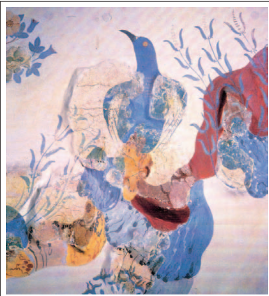
Το γαλάζιο πουλί, τοιχογραφία από την Κνωσό