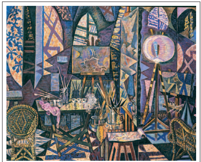
Νίκος Χατζηκυριάκος-Γκίκας, Το εργαστήριο του Καλλιτέχνη