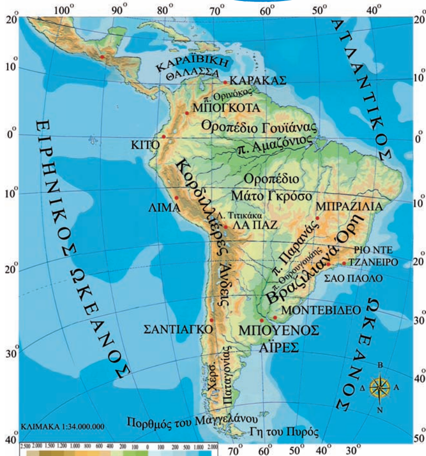
Εικόνα 42.1: Γεωμορφολογικός χάρτης Νότιας Αμερικής