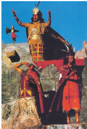
Εικόνα 43.2: Ινδιάνοι του Περού στη γιορτή του Ήλιου