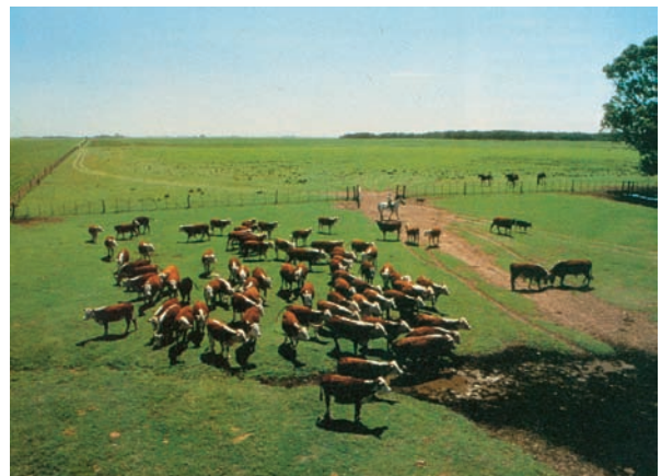
Εικόνα 42.3: Βοοειδή στα πάμπας της Αργεντινής

Ο Αμαζόνιος έχει μικρότερο μήκος από τον Νείλο, αλλά ο όγκος του νερού που μεταφέρει στη θάλασσα είναι μεγαλύτερος από τον όγκο του νερού που μεταφέρουν ο Νείλος και ο Μισισσιπής μαζί. Λέγεται μάλιστα ότι αυτός μόνος του περιέχει το 20% του γλυκού νερού του πλανήτη. Ο Αμαζόνιος με τους παραποτάμους του δημιουργεί ένα πλωτό δίκτυο 80.000 χιλιομέτρων. Στις εκβολές του σχηματίζεται ένα τεράστιο «δέλτα», το οποίο περιέχει ολόκληρο νησί, το Μαρέχο, με έκταση όση είναι η έκταση της Δανίας.