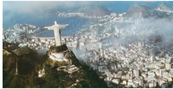
Εικόνα 43.5: Ρίο ντε Τζανέιρο, Βραζιλία

Κατά τον 19ο αιώνα, μετά τη Γαλλική Επανάσταση και τη Διακήρυξη των Δικαιωμάτων του Ανθρώπου, άρχισαν να ξεσπούν στα εδάφη της Νότιας Αμερικής επαναστάσεις για την απελευθέρωση των ντόπιων κατοίκων από τους αποικιοκράτες Ισπανούς. Σύμβολο του αγώνα για την ανεξαρτησία των βόρειων περιοχών ήταν ο Σιμόν Μπολιβάρ, αξιωματούχος γνωστός ως απελευθερωτής.