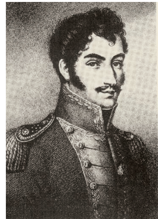
Εικόνα 43.3: Στρατηγός Μπολιβάρ

Οι κάτοικοι της Νότιας Αμερικής κατάγονται κυρίως από τέσσερις φυλετικές ομάδες: Η πρώτη ομάδα είναι των ινδιάνων, οι οποίοι κατοικούσαν στην περιοχή πριν από την ανακάλυψη της ηπείρου. Η δεύτερη ομάδα είναι οι Ίβηρες (Ισπανοί και Πορτογάλοι), που ήλθαν ως κατακτητές. Η τρίτη ομάδα είναι οι Αφρικανοί, τους οποίους έφεραν οι άποικοι σαν σκλάβους και η τέταρτη ομάδα είναι εκείνη των Ευρωπαίων, οι οποίοι κατοίκησαν στην Ν. Αμερική μετά την ανεξαρτησία των χωρών της. Ο σημερινός πληθυσμός προέρχεται από την επιμιξία των φυλών αυτών. Έχει συνδυάσει τα διαφορετικά πολιτιστικά στοιχεία, τα ήθη, τα έθιμα και τις συμπεριφορές και έχει διαμορφώσει πλέον το δικό του πολιτισμό.