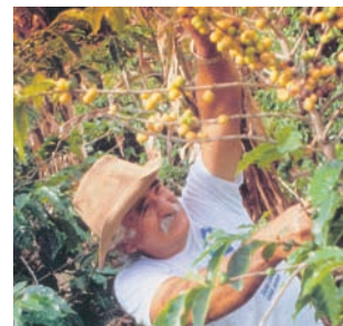
Εικόνα 43.8: Σάο Πάολο, συγκομιδή καφέ

Ας συζητήσουμε τους λόγους, για τους οποίους πολλά από τα κράτη της Νότιας Αμερικής μαστίζονται από τη φτώχεια. Τι προτείνουμε να αλλάξει, για να μπορέσουν να αναπτυχθούν και αυτά;