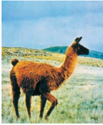
Εικόνα 42.4: Λάμα. Το ζώο των υψιπέδων

Η μόνη αξιόλογη λίμνη είναι η Τιτικάκα, στις όχθες της οποίας άνθισε ο πολιτισμός των Ίνκας.