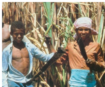
Εικόνα 43.7: Βραζιλία, καλλιεργητές ζαχαροκάλαμου