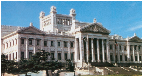
Εικόνα 43.4: Κοινοβούλιο του Μοντεβιδέο, Ουρουγουάη

Βρείτε στο χάρτη της τάξης τα κράτη της Νότιας Αμερικής και ονομάστε την πρωτεύουσα κάθε κράτους. Ποια από τα κράτη αυτά ωφελούνται από τη ροή του Αμαζονίου;