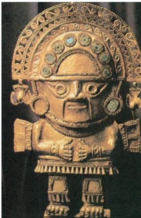
Εικόνα 43.1: Χρυσό ειδώλιο από τον πολιτισμό των Ίνκας