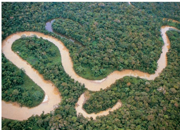
Εικόνα 42.2: Ζούγκλα Αμαζονίου

Ας συζητήσουμε μαζί για τα προβλήματα που προκαλεί στον πλανήτη μας η αλόγιστη εκμετάλλευση των δασών της Αμαζονίας.