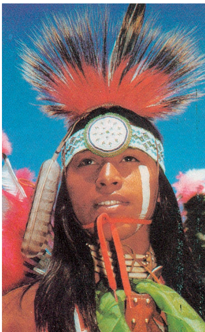
Εικόνα 40.1: Ινδιάνος των Πεδιάδων, Ηνωμένες Πολιτείες