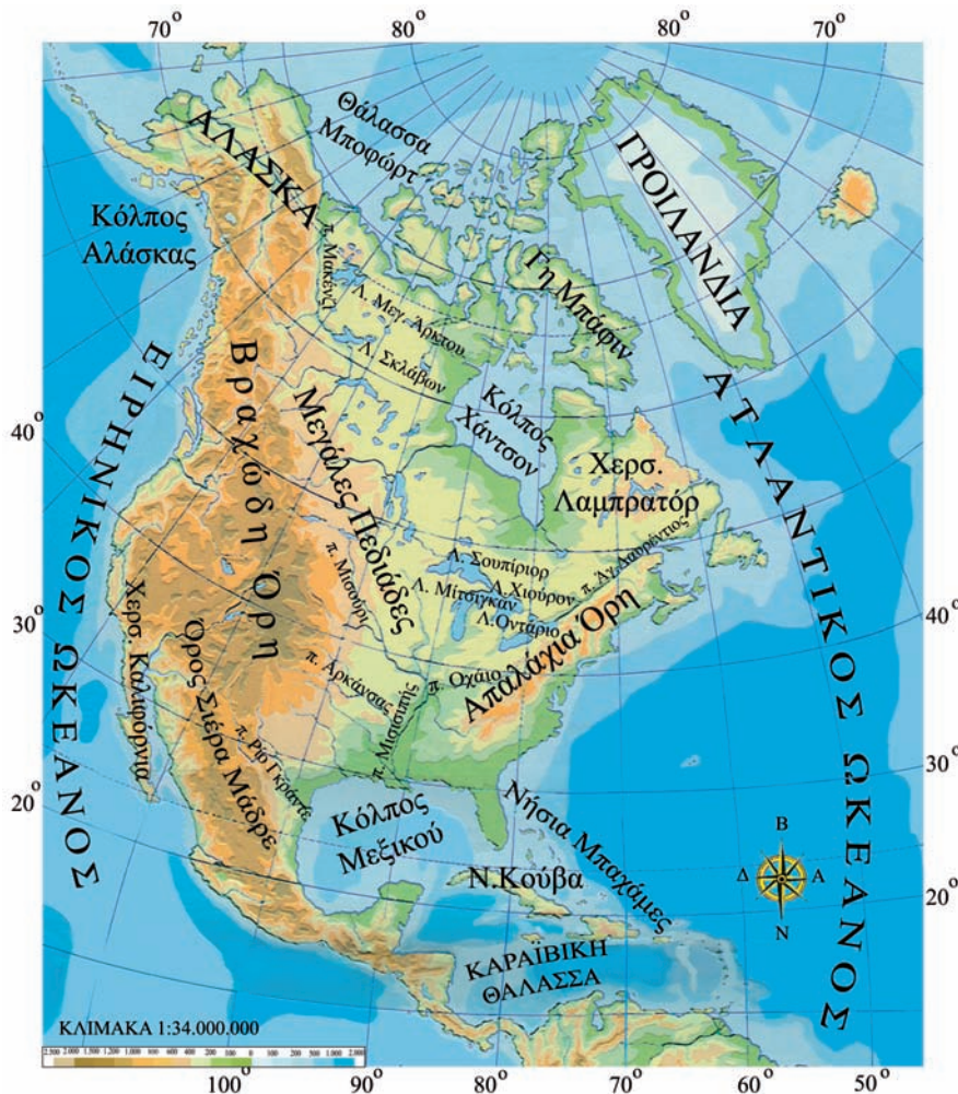
Εικόνα 39.1: Γεωμορφολογικός χάρτης της Βόρειας Αμερικής