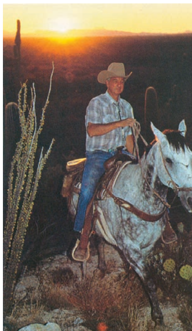
Εικόνα 40.2: Κτηνοτρόφος της Αριζόνα των Η.Π.Α.