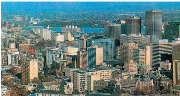
Εικόνα 40.3: Μόντρεαλ, Καναδάς

Συζητήστε τον τρόπο αντιμετώπισης των ινδιάνων από τους Ευρωπαίους αποίκους. Πιστεύετε ότι ήταν σωστός; Κατά τη δική σας άποψη ήταν δυνατή η συμβίωση των ινδιάνων με τους Ευρωπαίους; Τι οφέλη θα μπορούσε να έχει η ανθρωπότητα από μια τέτοια συμβίωση;