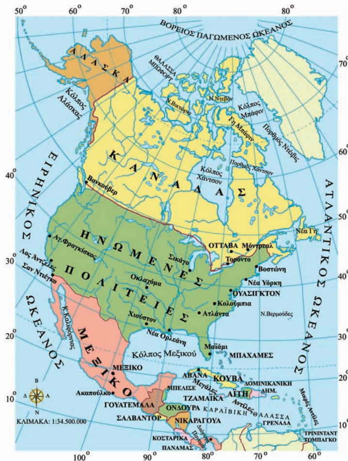
Εικόνα 41.1: Πολιτικός χάρτης της Βόρειας Αμερικής