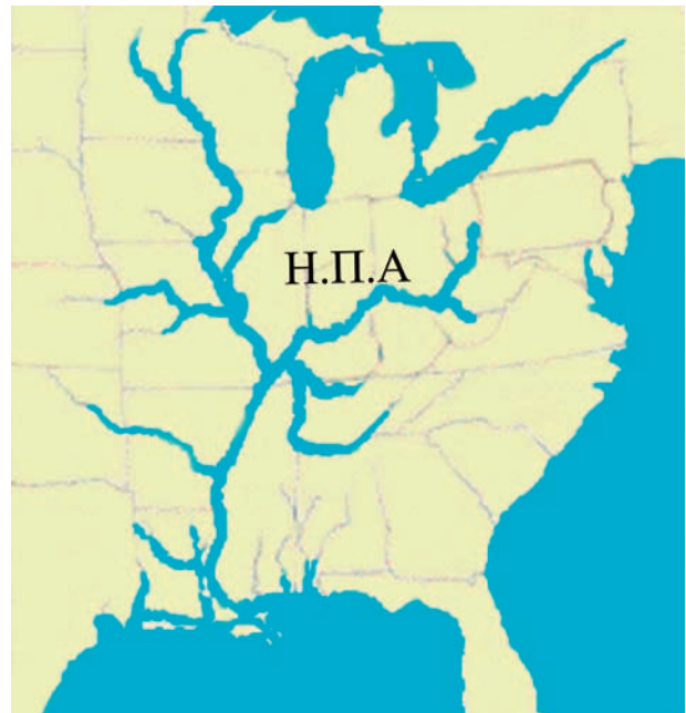
Εικόνα 39.2: Δίκτυο Μισούρι – Μισισιπή

Το υδρογραφικό δίκτυο της Βόρειας Αμερικής συμπληρώνεται και από τεχνητά κανάλια που ενώνουν τις λίμνες που υπάρχουν στο βόρειο τμήμα της. Οι λίμνες, τα κανάλια και ο ποταμός του Αγίου Λαυρεντίου διαμορφώνουν ένα ιδιαίτερα χρήσιμο πλωτό ποτάμιο σύστημα, που συνδέει το εσωτερικό της ηπείρου με τον Ατλαντικό Ωκεανό.