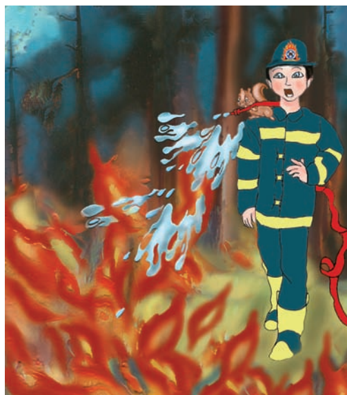
Εικόνα 27.2: Δασοπυροσβέστης

Ας συζητήσουμε και μία άλλη αιτία πρόκλησης πυρκαγιάς στο δάσος, τους εμπρησμούς. Για ποιους λόγους μπορεί ένας συνάνθρωπός μας να βάλει σκόπιμα φωτιά στο δάσος;