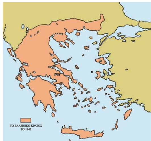
Εικόνα 28.1: Ιστορικοί χάρτες, που δείχνουν τις μεταβολές της έκτασης της Ελλάδας μετά το 1821