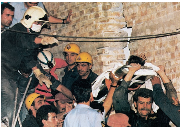
Εικόνα 27.3: Άνδρες της Ειδικής Μονάδας Αντιμετώπισης Καταστροφών (Ε.Μ.Α.Κ.) στο δύσκολο έργο τους

Το κράτος έχει δημιουργήσει υπηρεσίες για την παροχή βοήθειας στους ανθρώπους που πλήττονται από τις φυσικές καταστροφές. Αυτό όμως δεν αρκεί. Πρέπει όλοι να βοηθάμε κάθε συνάνθρωπό μας, όταν μας χρειάζεται. Στην περίπτωση ενός καταστρεπτικού σεισμού, για παράδειγμα, οι άστεγοι άνθρωποι χρειάζονται, εκτός από στέγη, είδη διατροφής και ένδυσης, φάρμακα και χρήματα και βέβαια την αγάπη μας και τη συμπαράστασή μας.