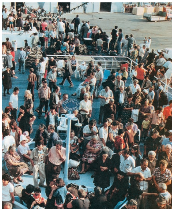
Εικόνα 29.2: Έλληνες πρόσφυγες από τη Γεωργία

Πολύ σημαντικοί παράγοντες της εξέλιξης του πληθυσμού είναι οι γεννήσεις και οι θάνατοι που συμβαίνουν. Στη χώρα μας τα τελευταία χρόνια ο αριθμός των γεννήσεων είναι μικρότερος από τον αριθμό των θανάτων, με αποτέλεσμα να επηρεάζεται αρνητικά ο πληθυσμός και να δημιουργείται έντονο δημογραφικό πρόβλημα . Ωστόσο, ενώ θα έπρεπε να έχουμε μείωση του πληθυσμού εξαιτίας της μείωσης των γεννήσεων, αντίθετα έχουμε αύξηση του πληθυσμού.