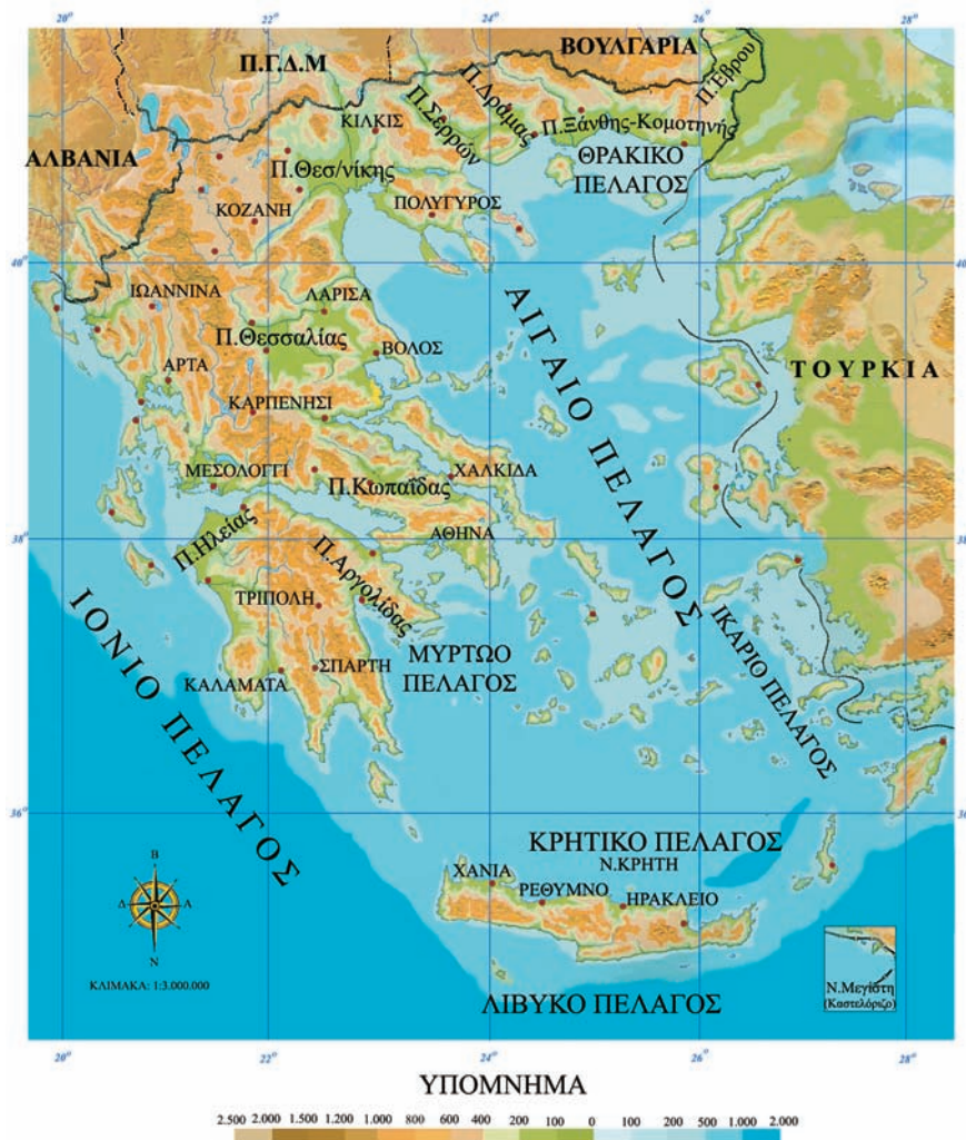
Εικόνα 14.1: Γεωμορφολογικός χάρτης Ελλάδας

Το Υπουργείο Αγροτικής Παραγωγής και Τροφίμων μάς πληροφορεί ότι οι λιγότες μεγάλες ελληνικές πεδιάδες είναι: