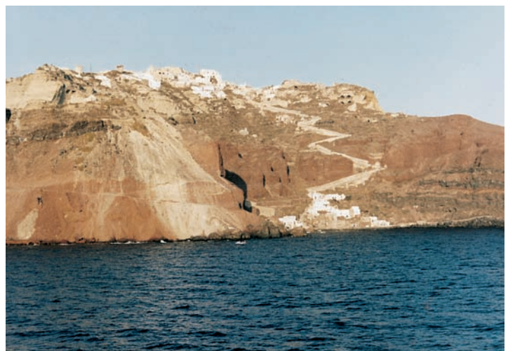
Εικόνα 11.3: Άποψη της Σαντορίνης

Ας εξετάσουμε αν ο τουρισμός που έχουν τα νησιά μας το καλοκαίρι, έχει και αρνητική επίδραση στον τρόπο ζωής των κατοίκων.