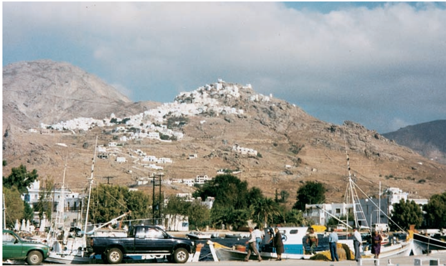
Εικόνα 11.1: Το λιμάνι και η χώρα της Σερίφου