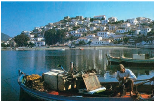
Εικόνα 11.2α: Προετομασία για ψάρεμα

Συζητήστε μεταξύ σας τους λόγους που κάνουν τους κατοίκους των νησιών να νιώθουν ανασφαλείς τους χειμερινούς μήνες. Κατόπιν να προτείνετε τρόπους βελτίωσης της ζωής τους στο νησί.