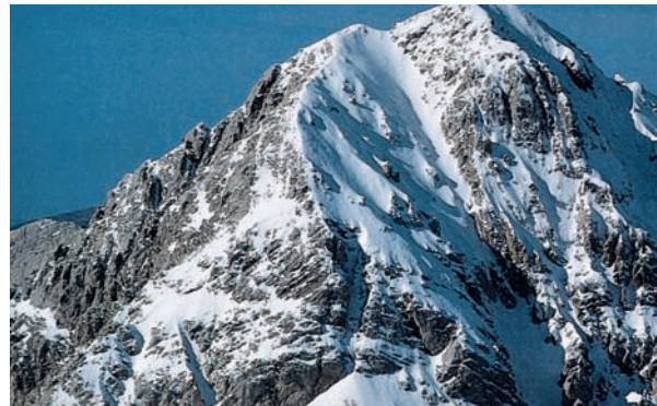
Εικόνα 13.1β: Ταΰγετος