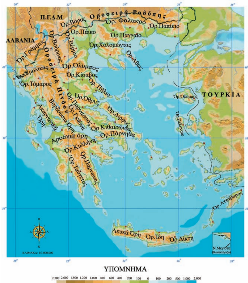
Εικόνα 13.2: Γεωμορφολογικός χάρτης της Ελλάδας

Όλα τα βουνά μαζί, μικρά και μεγάλα, αποτελούν ένα μεγάλο μέρος του κατακόρυφου διαμελισμού της χώρας μας. Αρκετά από αυτά έχουν άγριες κι απότομες πλαγιές, βαθιά φαράγγια και κοιλάδες που σχηματίζονται ανάμεσά τους και είναι τοπία, στα οποία πολύ δύσκολα πλησιάζει ο άνθρωπος. Τα περισσότερα βουνά έχουν κατεύθυνση από τα βορειοδυτικά προς τα νοτιοανατολικά.