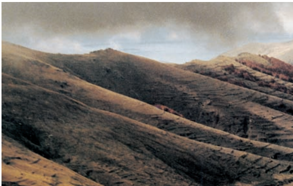
Εικόνα 13.1α: Βόρας (Καϊμακτσάλαν)