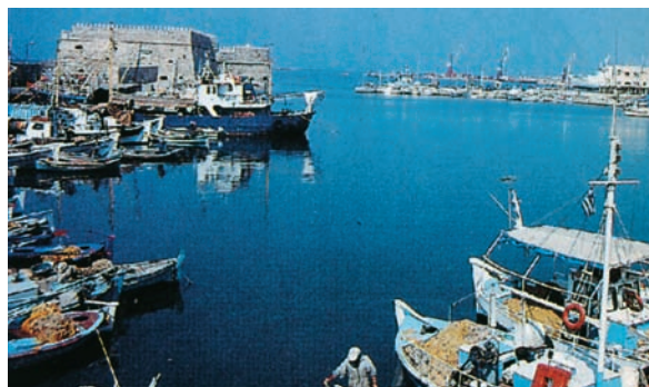
Εικόνα 12.3: Το λιμάνι του Ηρακλείου