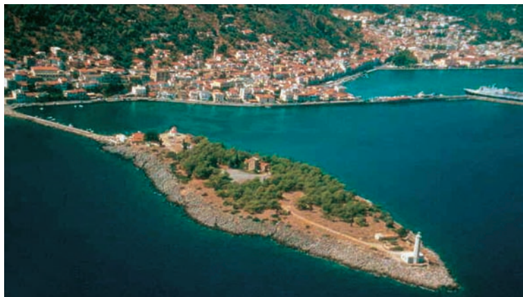
Εικόνα 12.2: Γύθειο

Ας συζητήσουμε γιατί οι πειρωτικές πόλεις από την αρχαιότητα έως και σήμερα νιώθουν την ανάγκη της στενής συμμαχίας-συνεργασίας με μια πόλη παραθαλάσσια, δηλαδή με το επίνειό τους.