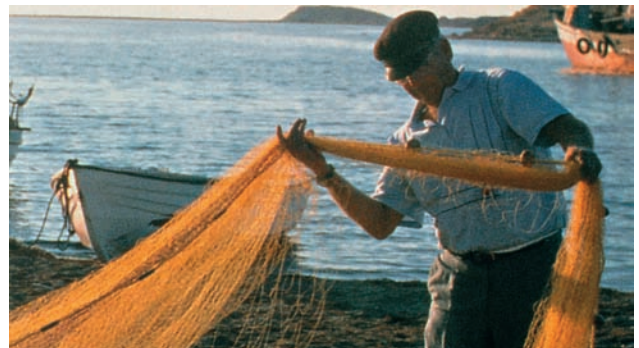
Εικόνα 11.2β: Μέσα στη βάρκα

Οι κάτοικοι των ελληνικών νησιών γίνονται κυρίως ναυτικοί, ψαράδες, σφουγγαράδες. Τα νησιά μας είναι υπερήφανα για την εξέλιξη της ελληνικής ναυτιλίας. Ορισμένα νησιά μάλιστα φημίζονται για τους καλούς ναυτικούς και τους εφοπλιστές τους. Μερικά άλλα είναι ονομαστά για τους σφουγγαράδες τους.