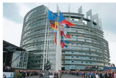
Εικόνα 42.4: Μάιος 2004: Στιγμιότυπο της έπαρσης των σημαίων των 10 νέων κρατών-μελών της Ευρωπαϊκής «οικογένειας» στην έδρα του Ευρωπαϊκού Κοινοβουλίου στο Στρασβούργο