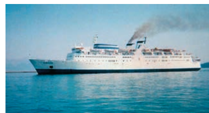
Εικόνα 40.3: Πλοίο εμπορικού ναυτικού

Η ιδιαίτερη αναφορά στις υπηρεσίες του Τουρισμού και της Ναυτιλίας γίνεται επειδή οι δύο τομείς αυτοί αποτελούν τον ακρογωνιαίο λίθο της ελληνικής οικονομίας.