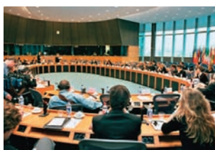
Εικόνα 42.3: Επιτροπή του Ευρωπαϊκού Κοινοβουλίου

Ας συζητήσουμε μαζί πώς μέσα σε αυτόν τον κοινωνικό και οικονομικό οργανισμό κάθε κράτος-μέλος θα διατηρήσει την πολιτιστική του ταυτότητα, δηλαδή τη γλώσσα, τη θρησκεία, τις παραδόσεις, τον πολιτισμό, στοιχεία απαραίτητα για τη διατήρησή του.