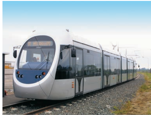
Εικόνα 41.1: Μεγάλα συγκοινωνιακά έργα της Ελλάδας

Η παραπάνω εικόνα παρουσιάζει τρία από τα μεγαλύτερα συγκοινωνιακά έργα, τα οποία καθορίζουν την πορεία της πατρίδας μας στον 21ο αιώνα. Ας συζητήσουμε τα σημασία αυτών των έργων τόσο στην καθημερινή μας ζωή όσο και στην οικονομική ανάπτυξη της χώρας μας.