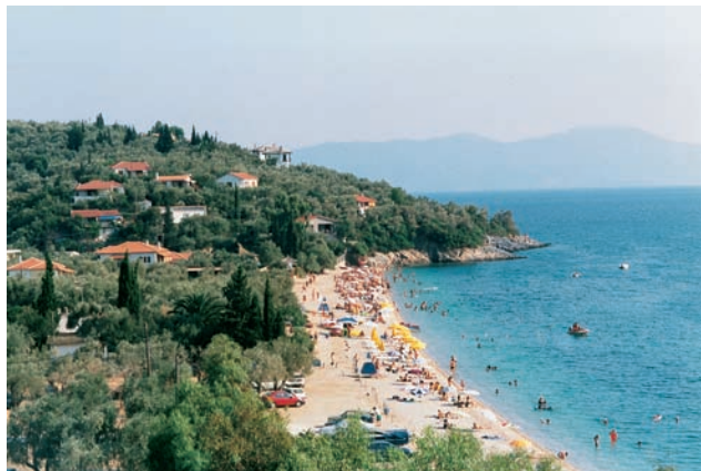
Εικόνα 40.2: Άφισσος. Ένα από τα σπουδαιότερα παραθεριστικά κέντρα της περιοχής του Βόλου.

Τουρισμός. Τον Τουρισμό αποτελούν οι υπηρεσίες εκείνες, οι οποίες ασχολούνται με τις μετακινήσεις των ανθρώπων που γίνονται για ψυχαγωγικούς, ενημερωτικούς και μορφωτικούς λόγους. Η Ελλάδα είναι μια ανεπτυγμένη τουριστικά χώρα. Το πανέμορφο ελληνικό περιβάλλον με δύο χιλιάδες μαγευτικά νησιά και τα εκπληκτικά αρχαία μνημεία προσελκύουν κάθε χρόνο αρκετά εκατομμύρια τουρίστες. Για τη σωστή εξυπηρέτηση αυτών των επισκεπτών οι τουριστικές υπηρεσίες της χώρας μας πρέπει να είναι σε πολύ ικανοποιητικό βαθμό οργανωμένες.