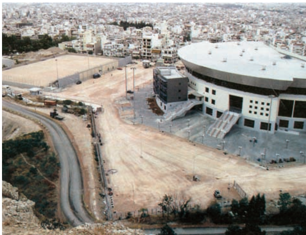
Εικόνα 43.1: Γυμναστήριο Άρσης Βαρών (Νίκαια)