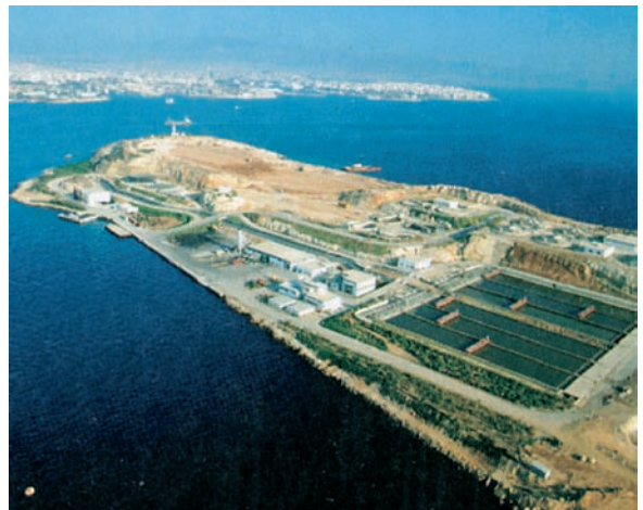
Εικόνα 43.2: Ψυττάλεια, Βιολογικός καθαρισμός

Οι φωτογραφίες που βλέπουμε παρουσιάζουν μερικούς από τους κυριότερους τομείς δράσης της Ευρωπαϊκής Ένωσης. Ας συζητήσουμε μαζί πώς η Ευρωπαϊκή Ένωση με τους κανονισμούς της έχει παρέμβει στα καθημερινά μας προβλήματα διαμορφώνοντας καλύτερη ποιότητα ζωής.