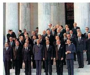
Εικόνα 42.2: Αναμνηστική φωτογραφία από την ένταξη της Ελλάδας στην Ε.Ο.Κ.

Στις 28 Μαΐου του 1979, ο τότε πρωθυπουργός της Ελλάδας Κωνσταντίνος Καραμανλής υπέγραψε στο Ζάππειο Μέγαρο την είσοδο της χώρας μας στην Ε.Ο.Κ.. Η πατρίδα μας μπήκε στη μεγάλη οικογένεια της ενωμένης Ευρώπης.