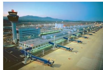
Εικόνα 41.5: Το αεροδρόμιο Ελ. Βενιζέλος

Το αεροδρόμιο «Ελευθέριος Βενιζέλος» των Αθηνών είναι ένα από τα μεγαλύτερα και πιο σύγχρονα αεροδρόμια του κόσμου. Βρείτε από το χάρτη της εικόνας 41.2 ποιες ελληνικές πόλεις είναι συνδεδεμένες μαζί του αεροπορικώς.