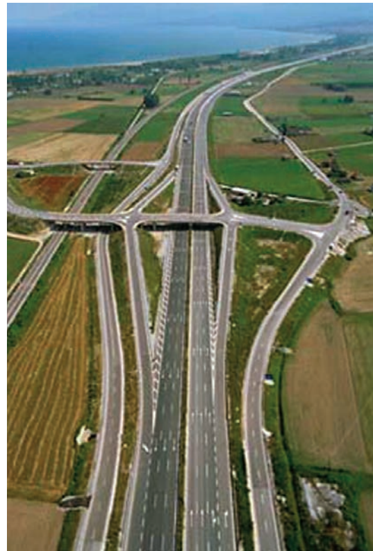
Εικόνα 41.3: Π.Α.Θ.Ε. Νέα Εθνική Οδός. Τμήμα: Δίον-Κατερίνη

Η μορφολογία του εδάφους της πατρίδας μας είναι μία από τις αιτίες που δεν επέτρεψαν την επέκταση του σιδηροδρομικού δικτύου σε ολόκληρο τον ηπειρωτικό κορμό. Γι' αυτό το λόγο δόθηκε μεγάλη σημασία στην ανάπτυξη του οδικού δικτύου για την επικοινωνία των πόλεων (μικρών και μεγάλων) μεταξύ τους.