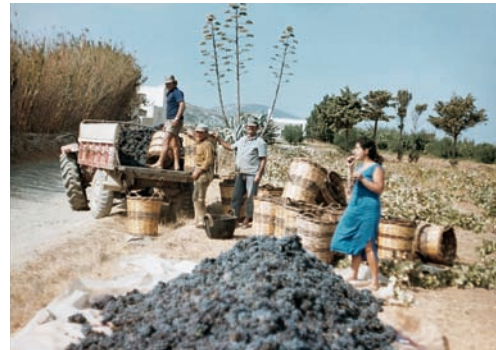
Εικόνα 36.2: Τρύγος στην Πάρο

Τα κυριότερα αγροτικά προϊόντα που παράγονται στη χώρα μας είναι: δημητριακά, ελιές-λάδι, σταφύλια-κρασί, εσπεριδοειδή, βιομηχανικά φυτά (καπνά, βαμβάκι, τεύτλα), λαχανικά. Πολλά από αυτά οι αγρότες μας με τη χρήση σύγχρονων μηχανημάτων τα τυποποιούν και τα εξάγουν και σε άλλες χώρες. Οι οργανωμένες εξαγωγές αγροτικών προϊόντων βοηθούν πολύ στην ανάπτυξη της ελληνικής οικονομίας.