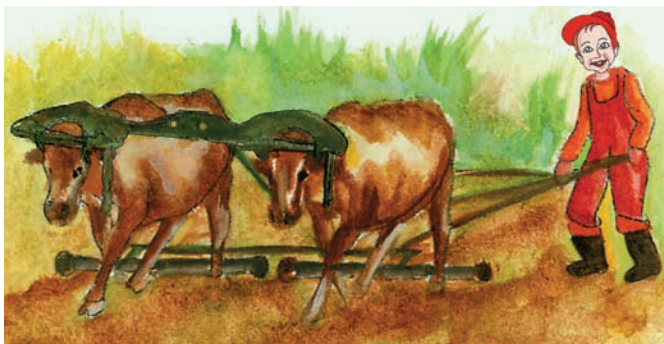
Εικόνα 36.3α: Παλιός τρόπος καλλιέργειας της γης

Το κράτος, για να αντιμετωπίσει αυτά τα προβλήματα, έχει δημιουργήσει οργανωμένες υπηρεσίες, όπως είναι η Πανελλήνια Συνομοσπονδία Ενώσεων Αγροτικών Συνεταιρισμών (ΠΑΣΕΓΕΣ), το Υπουργείο Αγροτικής Ανάπτυξης και Τροφίμων, η Αγροτική Τράπεζα, ο Οργανισμός Γεωργικών Ασφαλίσεων (Ο.Γ.Α.) κ.ά., οι οποίες βοηθούν οικονομικά και συμβουλευτικά τους αγρότες.