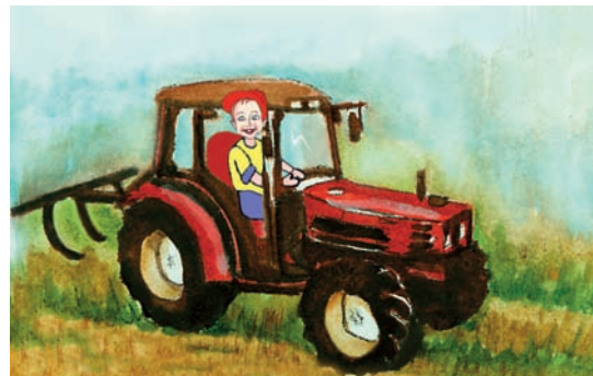
Εικόνα 36.3β: Σύγχρονος τρόπος καλλιέργειας της γης