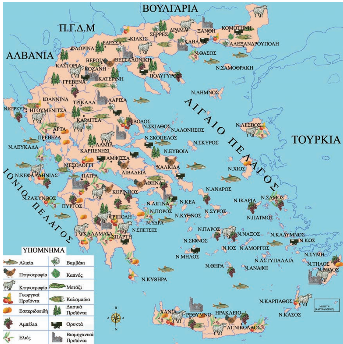
Εικόνα 36.1: Χάρτης παραγωγής προϊόντων της Ελλάδας