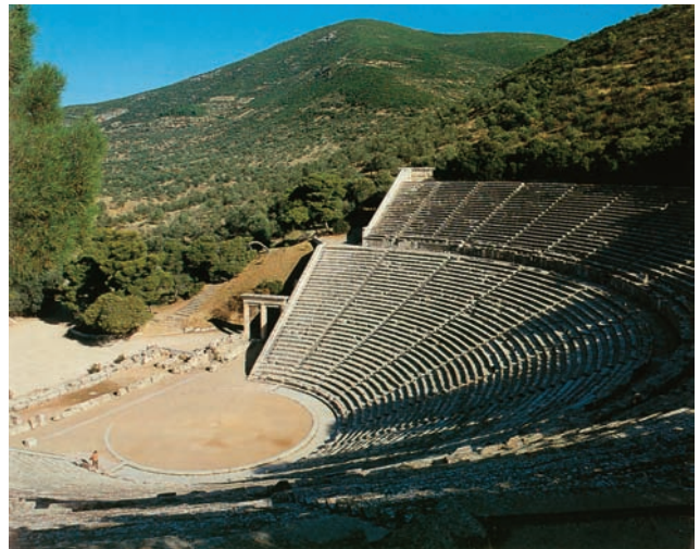
Εικόνα 35.2: Αρχαίο θέατρο Επιδαύρου

Ας βρούμε σε ποιο νομό βρίσκονται οι πόλεις που προαναφέραμε. Ποιο σπουδαίο στοιχείο (ιστορικό, τουριστικό ή εμπορικό) έχει να παρουσιάσει κάθε μία από αυτές;