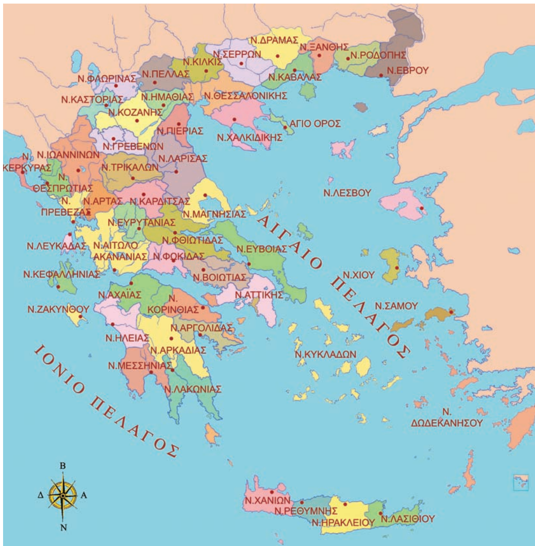
Εικόνα 35.1: Πολιτικός χάρτης της Ελλάδας