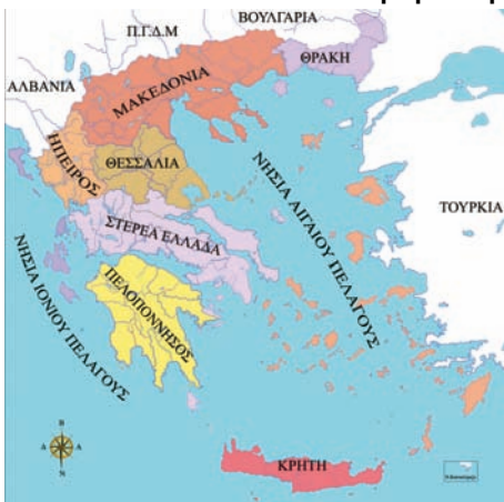
Εικόνα 34.1: Γεωγραφικά Διαμερίσματα της Ελλάδας

3. Παρατήρησε το χάρτη των περιφερειών. Μία μεγάλη περιοχή του γεωγραφικού διαμερίσματος της Στερεάς Ελλάδας και μία άλλη, επίσης μεγάλη περιοχή του διαμερίσματος της Πελοποννήσου, αποτελούν μία περιφέρεια. Με τη βοήθεια του γεωμορφολογικού χάρτη μελέτησε γεωμορφολογικά στοιχεία, κλίμα κ.λπ. της συγκεκριμένης περιοχής. Μπορείς να ερευνήσεις το λόγο, για τον οποίο αποτέλεσαν αυτά τα τμήματα μία περιφέρεια;