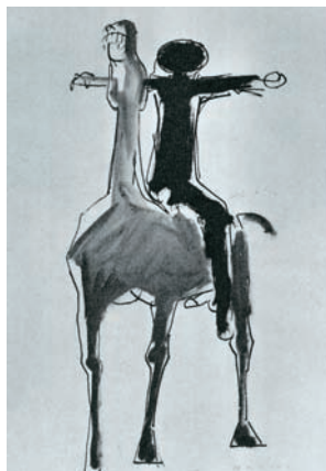
Σχέδια με άλογα και αναβάτες του Ιταλού γλύπτη Μαρίνο Μαρίνι (εικ. 1,2).

Ο Καλαμάρας και ο Μαρίνι ασχολήθηκαν με τη μελέτη του αλόγου και μεγάλο μέρος της δημιουργίας τους με σχέδια και γλυπτά είναι αφιερωμένο σ' αυτό.