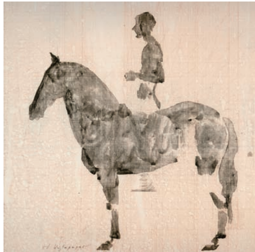
Σχέδια με άλογα του Δημήτρη Καλαμάρα (εικ. 3,4).