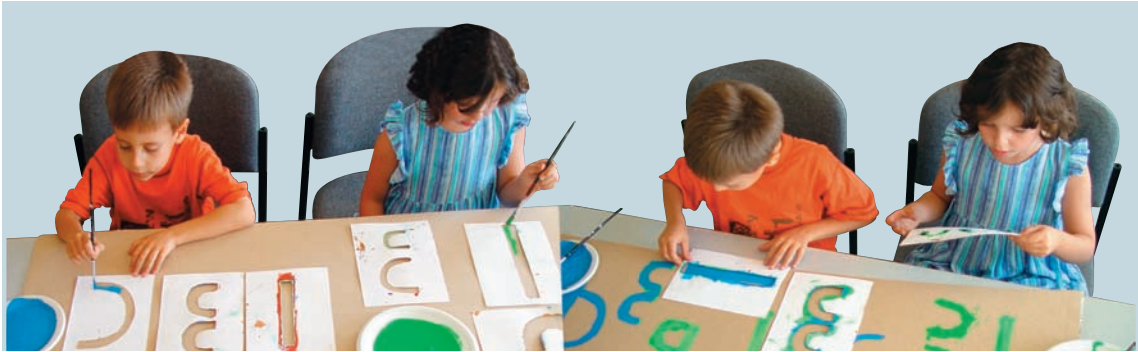
Ε: Το ξέρω αυτή είναι η τεχνική του στένσιλ .

Σ: Ξέρεις ότι μόνο με ευθείες και καμπύλες μπορούμε να φτιάξουμε όλα τα γράμματα και τους αριθμούς; Χρειαζόμαστε χαρτόνια, μολύβια και ένα ψαλίδι. Κοίτα τι εύκολο που είναι!