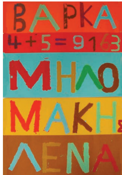
Σ: Με στένσιλ φτιάχνουν και τις πινακίδες!