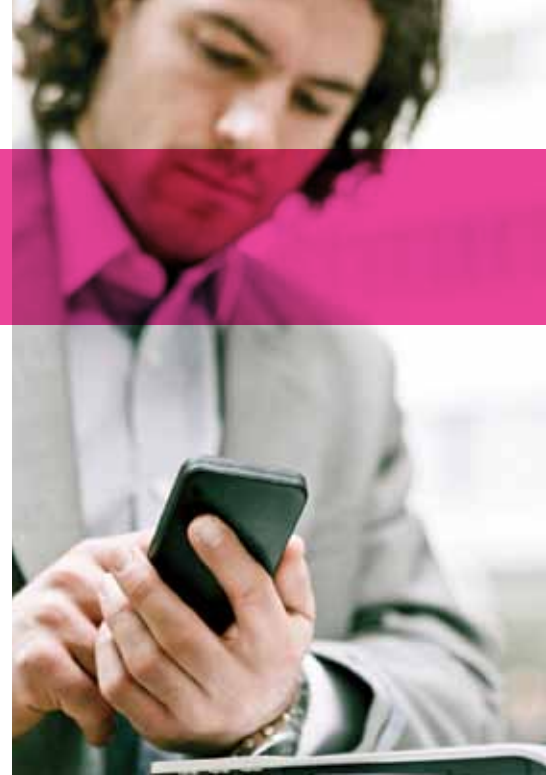
Figure 1. Gamme de solutions de communication Alcatel-Lucent Office

Notre gamme de solutions est fiable, ouverte et repose sur les normes du secteur. La modularité est présente à tous les niveaux des solutions de communication Alcatel-Lucent Office, depuis la suite de communication et les licences logicielles jusqu'au serveur de communication et à l'infrastructure de réseau qui répondent parfaitement aux exigences des clients. Avec notre gamme de solutions, vous pouvez obtenir une garantie matérielle et de nombreux services, du simple contrat de maintenance à un système complet comportant de nouvelles applications et technologies. Les solutions de communication Alcatel-Lucent Office sont en avance sur leur temps et s'appuient sur un serveur de communication sur IP qui utilise des protocoles standard et offre de puissantes fonctionnalités.