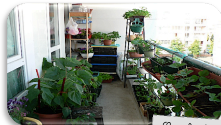
Sur le balcon.