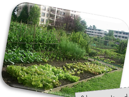
Un jardin de ville.

On peut planter des légumes-racines comme le radis, des légumes-feuilles comme la salade, des légumes-fruits comme la tomate et des légumes-graines comme les haricots.