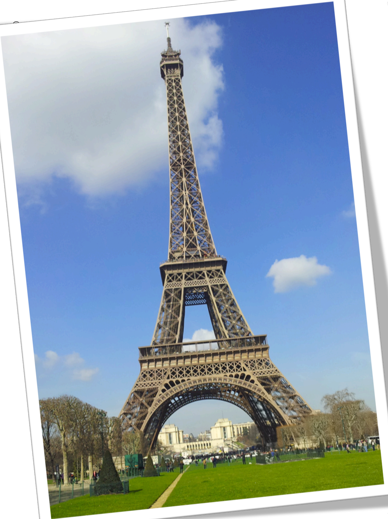
La tour Eiffel