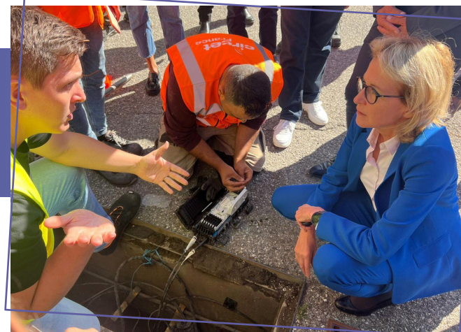
↑ Visite terrain autour d'un point de branchement optique situé en chambre.