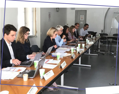
↑ Réunion à la mairie de Marseille avec les différentes parties prenantes aux déploiements de la fibre optique.