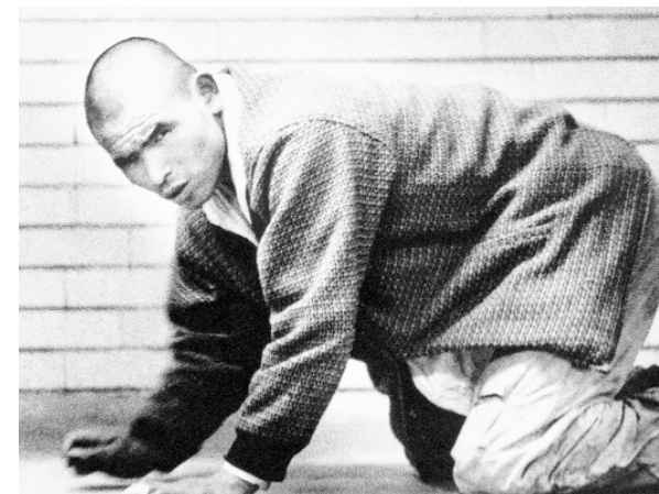
Nippon gekijo shashinchoi, 1968

abrumadora frecuencia protagonizan las fotos de Moriyama, son seres sin nombre, o personas de nombre pequeño: transeúntes que esperan, marchan o se alejan rodeados de un halo denso, único, que la cámara y el laboratorio fotográfico tradicional de Moriyama posibilitan. Gracias a ello, a su forma de mirar y de reproducir lo captado, vemos que la soledad es ternura y que los retratos colectivos pueden ser a la vez tan tristes como dulces. El mismo autor afirma: "la fotografía es una acción de fijar el tiempo, y no es la de expresar el mundo. La cámara es una herramienta inadecuada para extraer la visión del mundo o la de la belleza. Si un fotógrafo intenta incorporarse felizmente al mundo usando la perspectiva tradicional con la cámara, terminará cayendo en el agujero de la idea que ha excavado por sí mismo. La fotografía es un medio que solo existe fijando momentáneamente el descubrimiento y la cognición que se encuentran en el imparable mundo exterior."