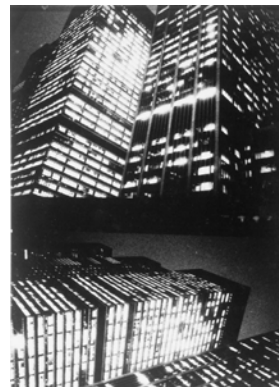
71 N.Y., 1971 Nippon gekijo shashinchoi, 1968 Shinjuku, 2000-2004

La fotografía de Daido Moriyama es callejera. Hábil y experimentado captor de ese sin fin de momentos de evanescencia que la calle ofrece, durante cuatro décadas ha ido dando cuenta a modo de relato cíclico de que precisamente es la vulnerabilidad de la calle la que hace posible la heroicidad anónima de muchos gestos cotidianos e incluso casi vulgares que se convierten en salvadores. Quienes con