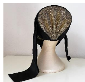
Katalog nr. 51