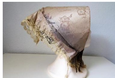
Katalog nr. 101

Tid: Ca. 1850 Beskrivelse: Sort silke med indvævet gulgrønt mønster. Sort blonde i kanten på de 2 sider. Indlagt pap.