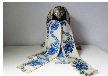
Katalog nr. 125