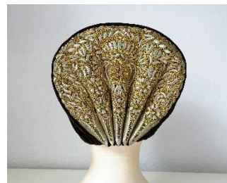
Katalog nr. 44