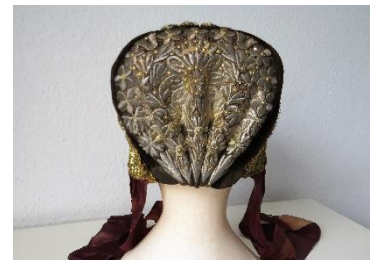
Katalog nr. 40