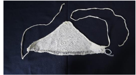
Katalog nr. 149