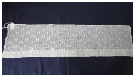
Katalog nr. 153

153 Ejer og nr.: KE – 68 Hjemsted: Ukendt Tid: Beskrivelse: Tyndt mønstervævet moll. Ombuk i forkant.