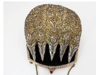
Katalog nr. 91

90 Ejer og nr.: KE – 06-14-1 Hjemsted: Ukendt Tid: 1870-90 Beskrivelse: Nakke til puldhue med 5-foldet, stiv nakke. Guldbroderi. Sort fløjl.