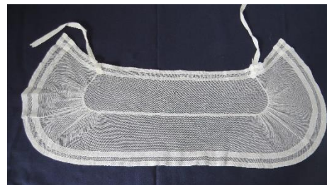
Katalog nr. 168