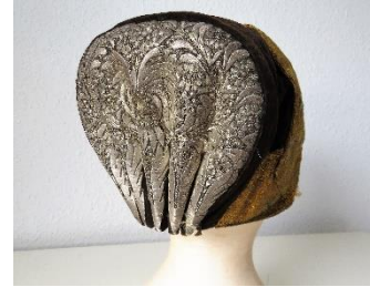
Katalog nr. 37