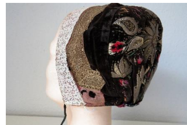
Katalog nr. 73

72 Ejer og nr.: KE – 26 Hjemsted: Ukendt Tid: 1850-60 Beskrivelse: Puldhue med 5-foldet, stiv nakke. Brun fløjl i nakke, Issestykke af sort fløjl. Røde silkebånd i for- og underkant. Stemplet: A.Kongsløv