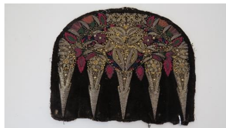
Katalog nr. 24