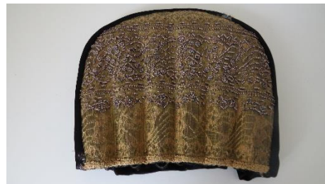
Katalog nr. 63

63 Ejer og nr.: KE – 11-10-14-1 Hjemsted: Ukendt Tid: 1870-90 Beskrivelse: Nakke med 6-folder af guldgaloner med perlebroderi til puldhue med, stiv nakke.