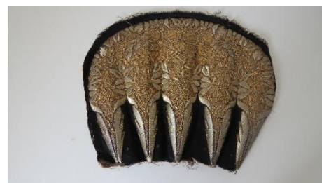
Katalog nr. 93

93 Ejer og nr.: KE – 38 Hjemsted: Ukendt Tid: 1860-70 Beskrivelse: Nakke til puldhue med 5-foldet, stiv nakke. Guldbroderi. Sort halvsilke.