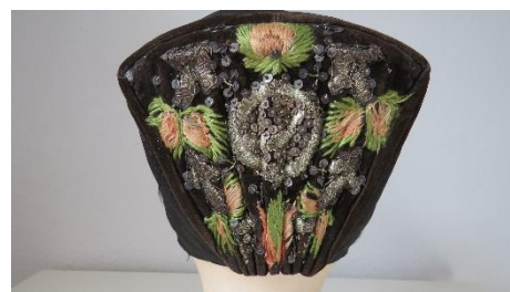
Katalog nr. 8

Tid: 1800-20 Beskrivelse: Stiv nakke til puldhue. Guldgalon. 9 folder. Rest af issestykke i blå silke.