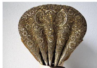
Katalog nr. 59

En lille gruppe huer med metalbroderede nakker skiller sig ud rent mønstermæssigt. Er de måske fra metalhuernes sidste tid, måske 1880-90? Enkelte huekoner vedblev at sy "klare nakker" til ind i 1890'erne. De får igen en overvægt af sprængning, hvilket giver mønstret en anden klarhed. Formerne bliver desuden mere runde og bløde – lidt Jugend-agtigt. Kan der være tidlig jugend? En hypotese, som ikke er bekræftet. Måske er det bare en eller flere huekoners arbejde i en tidligere periode?