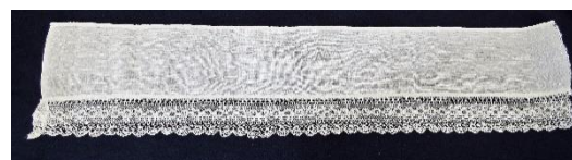
Katalog nr. 157

157 Ejer og nr.: KE – 21 A Hjemsted: Salby, Lellinge Tid: 1860-70 Beskrivelse: Smalt lærred med maskinblonde i forkant. Hører til huerne katalog nr. 113, 114,115