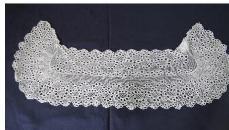
Katalog nr. 16