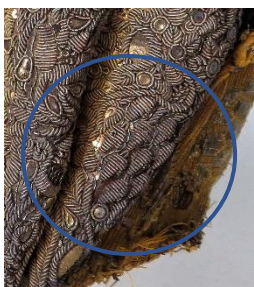
Katalog nr. 94