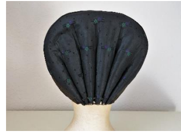
Katalog nr. 67

67 Ejer og nr.: KE – 01-10 Hjemsted: Ukendt Tid: ca. 1860 Beskrivelse: Puldhue med 6-foldet, stiv nakke. Sort silke med lille kulørt mønster. Sorte silkebånd om for- og underkant.