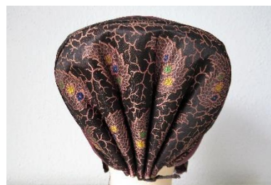
Katalog nr. 66

65 Ejer og nr.: AMJ – 250-2011 Hjemsted: Ukendt Tid: ca. 1860 Beskrivelse: Puldhue med 5-foldet, stiv nakke. Sort mønstervævet silke. Sorte silkebånd om for- og underkant.