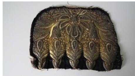
Katalog nr. 41