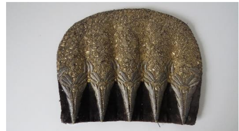
Katalog nr. 54

Tid: 1860-70 Beskrivelse: Puldhue med 5-foldet, stiv nakke. Sort halvsilke. Guldbroderi. Konehue pga. påsat gulddalon samt sort overbindebånd sat op på huen ved venstre side.