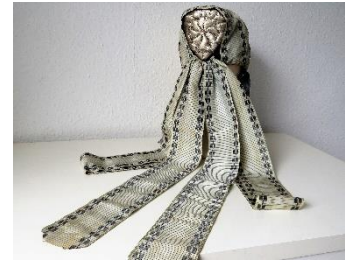
Katalog nr. 139

139 Ejer og nr.: KE – 79 Hjemsted: Ukendt Tid: 1860 Beskrivelse: Puldhue med blød nakke. Brunt fløjl. Pæreformet sølvbroderi. Grågrønne mønstrede silkebånd over issestykke og i nakkesløjfe. Rester af blå mønstervævede hagebånd.