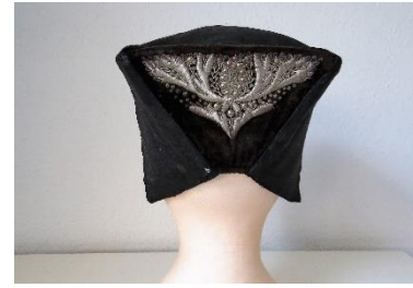
Katalog nr. 13