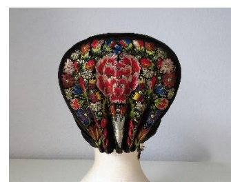
Katalog nr. 18