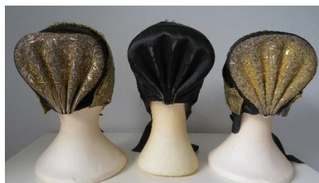
Katalog nr. 114, 116, 115