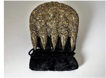
Katalog nr. 81

81 Ejer og nr.: AMJ – 79-1998 Hjemsted: Ukendt Tid: 1850-60 Beskrivelse: Nakke til puldhue med 5-foldet, stiv nakke. Sort halvsilke. Guldbroderi. Nakken er monteret på sort fløjl.