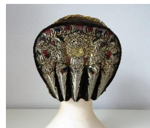
Katalog nr. 32