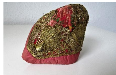
Katalog nr. 146

Man brugte ikke den samme farveholdning, som vi kender i dag med blå til drenge og rødt til piger.