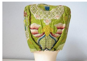
Katalog nr. 2