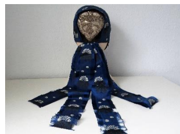
Katalog nr. 132

131 Ejer og nr.: IN – 8 Hjemsted: Ukendt Tid: 1840-50 Beskrivelse: Puldhue med blød nakke. Nakke af guldgalden. Lilla silkebånd med sort/hvidt mønster over issestykke og i nakkesløjfe.