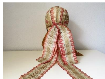
Katalog nr. 121

Beskrivelse: Puldhue med blød nakke. Gråsort mønstervævet stof med grønt mønster. Sorte mønstervævede silkebånd over issestykket, over nakken og i nakkesløjfe. "Halv nakke".