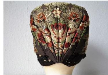
Katalog nr. 4

Puldhue af brocheret silke med brun bund. 6-foldet nakke. Nakken er polstret med papir og blå. Brun/sorte silkebånd i for- og underkant.