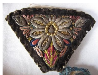
Katalog nr. 9