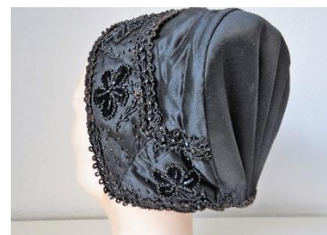
Katalog nr. 71

70 Ejer og nr.: KE – 11 Hjemsted: Ukendt Tid: 1880-1900 Beskrivelse: Puldhue med 6-foldet, stiv nakke. Sort mønstervævet silke. Sorte silkebånd i for- og underkant. Sort silke overbindebånd.