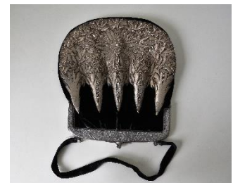
Katalog nr. 84

83 Ejer og nr.: KE – 55 Hjemsted: Ukendt. Tid: 1850-60 Beskrivelse: Nakke til puldhue med 5-foldet, stiv nakke. Sølvbroderi. Oprindeligt brunt fløjl. Syet over på sort fløjl.