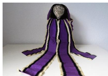
Katalog nr. 137

136 Ejer og nr.: Folkedans Danmark – 73 x 1A + B Hjemsted: Totterupgården, nær Karise. Tid: 1860 Beskrivelse: Puldhue med blød nakke. Sort silke. Pæreformet sølvbroderi med perler. Blå/brune stribede silkebånd over issestykke og nakkesløjfe samt i hagesløjfe.