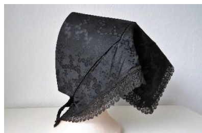
Katalog nr. 98