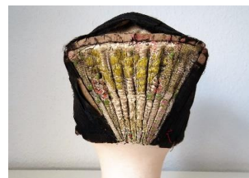
Katalog nr. 6

Puldhue i blå silkedamask. Meget kriget i siderne. Stiv nakke med 11 folder. Lille rest af rødt silkebånd på issestykket bagerst ved pulden.