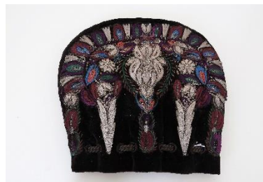
Katalog nr. 75