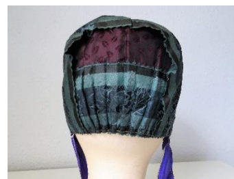
Katalog nr. 119

Beskrivelse: Puldhue med blød nakke. Brocheret silke. Lilla bund med grønt, rosa og gult mønster. Grønne silkebånd over issestykke og som nakkesløjfe samt hagebånd.