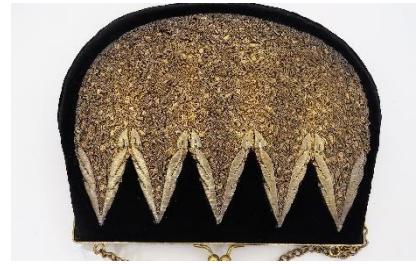
Katalog nr. 88

Tid: 1860-70 Beskrivelse: Nakke til puldhue med 5-foldet, stiv nakke. Guldbroderi. Sort halvsilke.