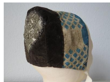
Katalog nr. 142

142 Ejer og nr.: KE – 81 Hjemsted: Ukendt Tid: 1840 Beskrivelse: Puldhue med blød nakke. Brunt fløjl. Pæreformet sølvbroderi. Issestykkets yderstof går ikke helt til forkant, da huen er forberedt til påsætning af silkebånd.