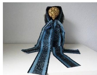
Katalog nr. 135

Tid: 1850-60 Beskrivelse: Puldhue med blød nakke. Sort mønstervævet silke. Brune silkebånd med sort/lilla mønster over issestykke og i nakkesløjfe. Brune silkehagebånd.