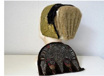
Katalog nr. 108

108 Ejer og nr.: Folkedans Danmark – 43 x 33 Hjemsted: Ukendt Tid: 1830-40 Beskrivelse: Puldhue med 5-foldet, stiv nakke. Nakke af brunt fløj. Issestykke af sort silke. Sølv- og silkebroderi. Konehue pga. påsat guldgalon. Mellemforet med blår.