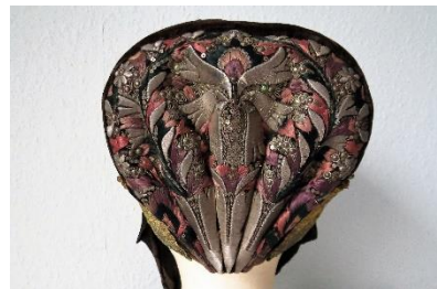
Katalog nr. 30