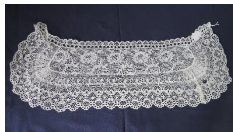
Katalog nr. 162