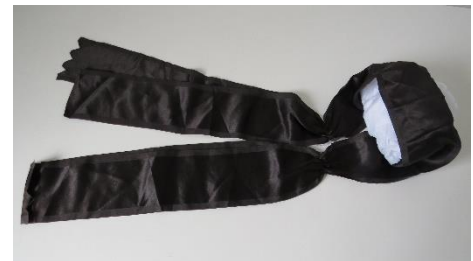
Katalog nr. 110

110 Ejer og nr.: Folkedans Danmark – 65 x 2 Hjemsted: Ukendt Tid: Fra 1830 Beskrivelse: Overbindebånd i sort silke til puldhue med 5-foldet, stiv nakke.