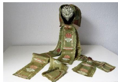
Katalog nr. 127