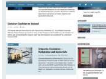
Sichtbarkeit auf der Homepage