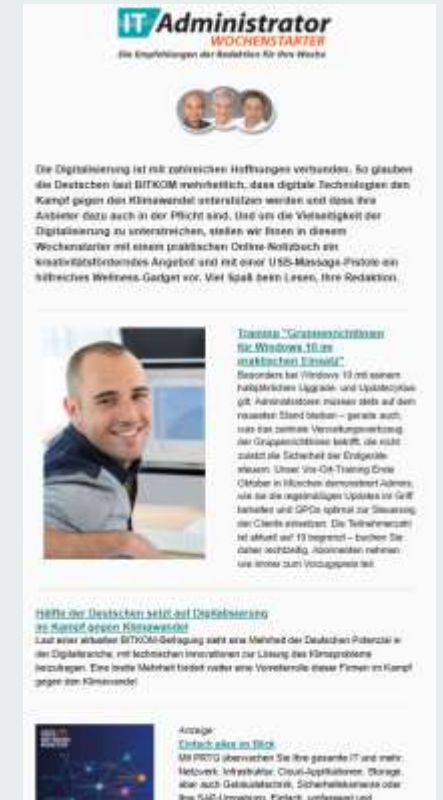
Wochenstarter HTML Newsletter