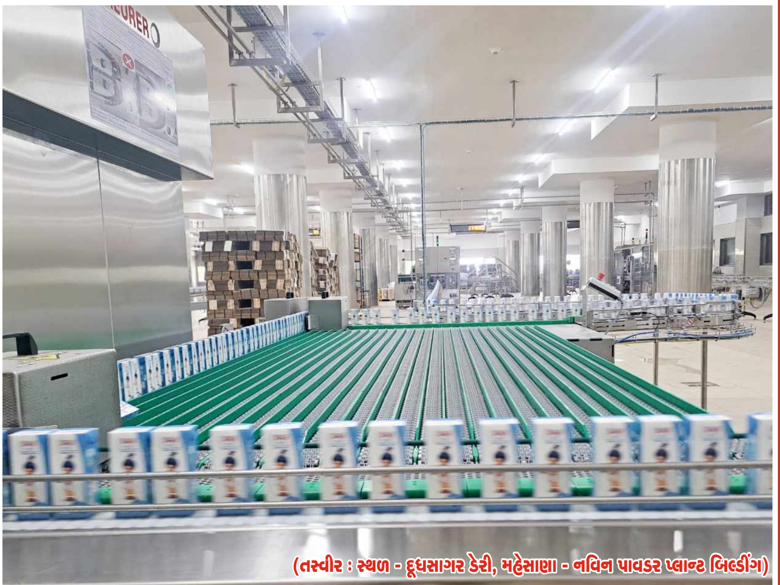
(તસ્વીર : સ્થળ - દૂધસાગર ડેરી, મહેસાણા - નવિન પાવડર પ્લાન્ટ બિલ્ડીંગ)

વ ટવૃક્ષના મીઠા ફળ પશુપાલકોને મળવાના છે તેની શુભ શરૂઆત આપણી સાગરમાં એક આખી નવી દૂધસાગર 180 દિવસ ચાલે તેવા વિશિષ્ટ દૂધના મૂલ્યવર્ધક ટેટ્રાપેકની શરૂઆત