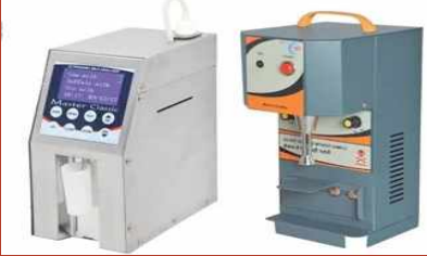
ફેટ-SNF એનેલાઈઝર મશીન

સંપૂર્ણ માનવ દખલ વિહીન અને મશીન આધારિત માપદંડો થી સૂસજ્જ કરી દેવામાં આવી છે પરિણામ સ્વરૂપ દૂધસાગર પત્રિકાને મળતી છેલ્લામાં છેલ્લી પ્રમાણભૂત માહિતી પ્રમાણે આપણા કાર્યક્ષેત્રની 1503 મંડળીઓ ઉપર આ એનેલાઈઝર મશીન આવી ચૂક્યા છે અને સુપેરે કામ કરી રહ્યા છે. આ વૈજ્ઞાનિક અભિગમો અને આવિષ્કારોના પરિણામે આજે મહેસાણા દૂધ સંઘમાં અગાઉની સરખામણીમાં હલકા દૂધની માત્રા 50% ઘટી જવા પામી હોવાથી આપણી શાખ અને ગુણવત્તા તથા મંડળીઓના રોજબરોજના સ્થાનિક ધર્ષણ બંધ થવા પામ્યા છે. નીચેના કોઠા ઉપરથી અમે દૂધસાગરમાં આવતા દૈનિક સરેરાશ દૂધના જથ્થાનો ઘટાડો મુકી રહ્યા છીએ જે હલકા દૂધ ઉપર લાગેલો કેરીનો અંકુશ સાબિત કરે છે.