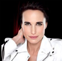
La actriz y modelo norteamericana Andie MacDowell es la imagen de la gama Revitalift Laser X3.

L'Oréal Paris es una de las más famosas marcas de cosméticos del mundo. Desde sus inicios, a principios del siglo pasado, la multinacional francesa siempre ha estado asociada a la innovación y la investigación.