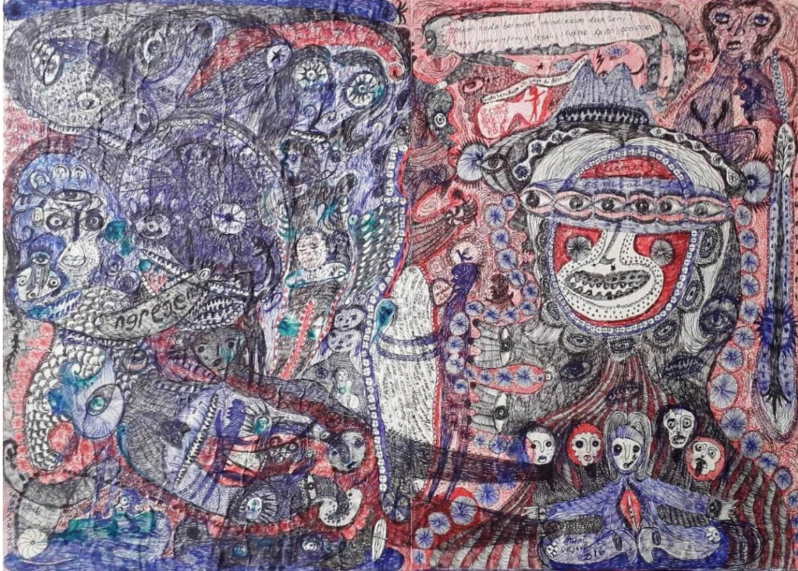
Imam Sucahyo, An offer from the Land Lord, 39,5 x 54,5cm

2015. 'BARE JOURNAL Vol.2 : LIAR'. Cata Odata, Ubud. Bali, Indonesia