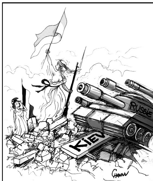
Caricature signée Chau (dans « Ouest-France »).

La satire fustige de longue date - depuis l'Antiquité-, la bêtise humaine, sur laquelle la guerre constitue un poste d'observation privilégié.