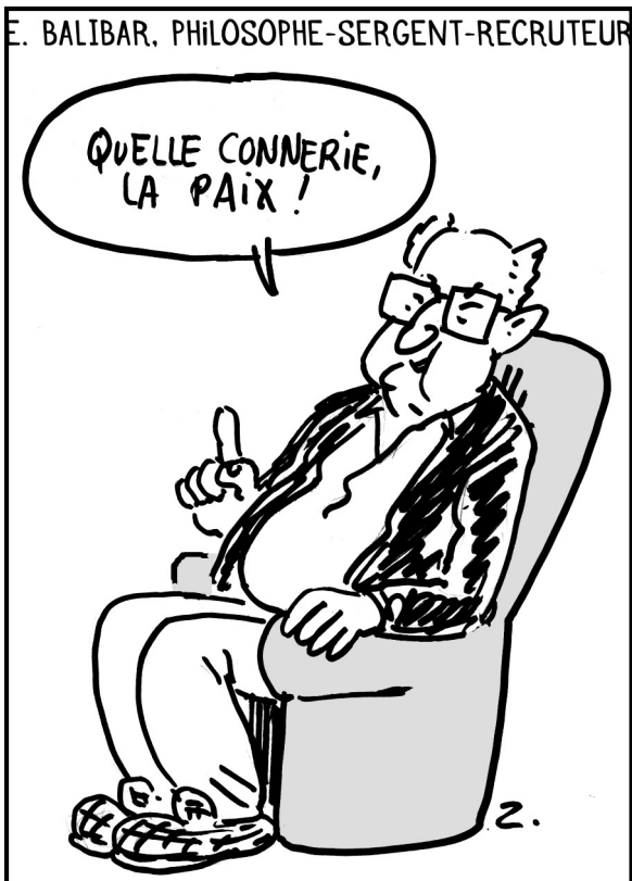
L'universitaire Etienne Balibar a donné une interview à « Médiapart » (7 mars), résumée ainsi sous forme de slogan : « Le pacifisme n'est pas une option ! »

Certains caricaturistes sont particulièrement doués pour résumer l'actualité politique et ramener le ping-pong idéologique gauche-droite à des proportions raisonnables ; ainsi Urbs dans « Le Canard Enchaîné » (2 mars) a « spoilé » le feuilleton de la campagne pour les présidentielles, sans doute moins passionnant pour les chroniqueurs que la campagne d'Ukraine. Z