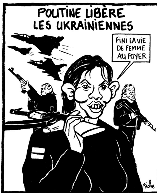
Caricature signée Biche dans « Charlie-Hebdo » (9 mars).