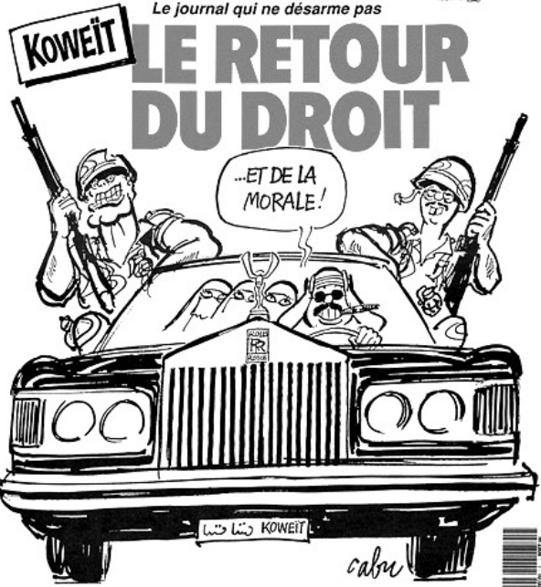
Une du 28 février 1991 signée Cabu de l'hebdo (n°7) « La Grosse Bertha », moquant le prétexte américain pour envahir l'Irak, qui n'était pas si éloigné que ça de la « dénazification ».