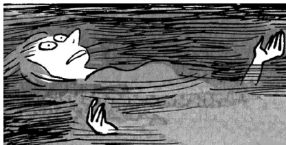
Autocaricature de C. Meurisse en Ophélie.

Du coup, petit à petit, Catherine Meurisse se sent mieux ; son confrère Luz publie une BD sur comment il a vécu les mois suivant le massacre, et C. Meurisse décide de faire la même chose.